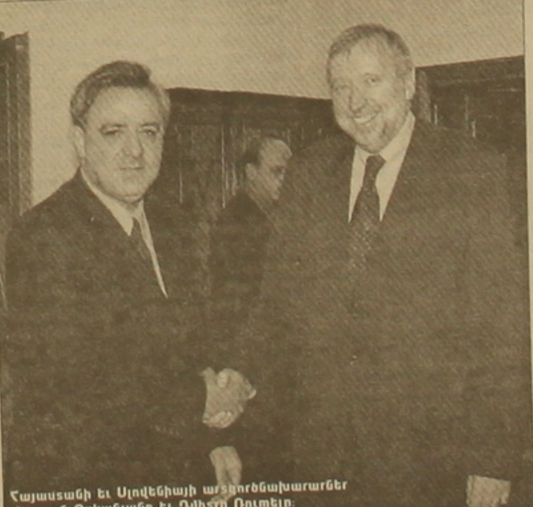
Հայաստանի և Սկաչուկի արձագանքաբարներ Կարոյան Օսկանյանը և Դմիտրի Ռուկոլելը:

«Մենք անմիջապես կառուցում ենք հաստատել դիվանագիտական խողովակներով և բանակցում ենք ռուսաստանյան ղեկավարության հետ: Եվ ուղղակի համոզված ենք, որ վերջինիս հետ համագործակցությամբ խնդիրն ու դրա հետագա զարգացումներին վերջ կդրվի», հավաստեց ՀՀ արձագանքաբարության ղեկավարը: