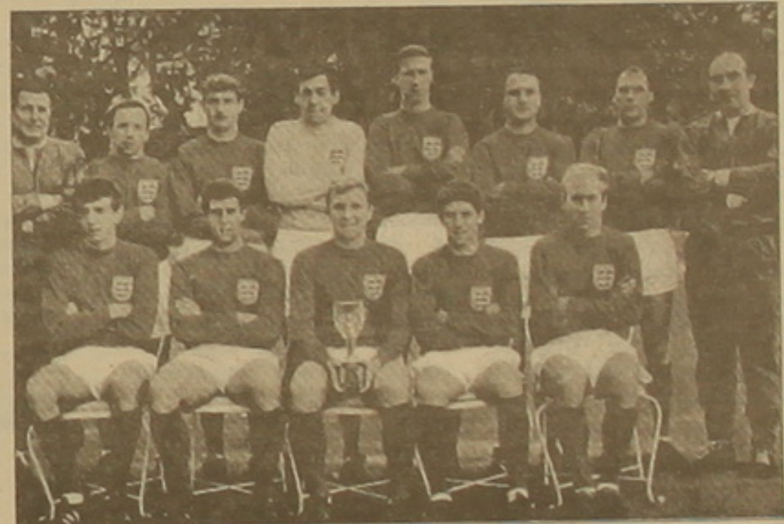
1966 թ. աշխարհի չեմպիոն Անգլիայի հավաքականը

Անգլիայի բազուկին սեղմելով նստել մրցավարների ձեռքն ի նշան երախտագիտության: Իսկ Թոմֆի Բահրամովն արժանացավ «Ոսկե սուլիչ» մրցանակին: Անգլիացիների հաղթանակը միանգամակ ընդունվեց մասնագետների կողմից, նշելով, որ նախնական փուլում հավաքականի խաղն առանձնակի սղավություն չէր քողել: Ամեն ինչ չէր զալիս խաղի վարման սակսիկան: Սակայն ոչ ոք չէր կարող ժխտել անգլիացի ֆուտբոլիստների կատարողական բարձր վարժեցությունը, որով աչի ընկան կապել գնդակի անվանի վարժեցներ Բոբի Չարլսոնը, Հեյսը, Մուրը, Պիեթրը: Իրեն հիանալի դրսևորեց դարձաբլիզի Գորդոն Բեննը՝ աչի ընկնելով հուսալի խաղով: Նա յուրօրինակ ռեկորդ սահմանեց դարձաբլիզի անհույս Պիեթրով 441 ռոմբ արձանակ: Առաջնության մեկնարկից մինչև Պորտուգալացիների հեռ կիսաեզրակալիչ հանդիմումը Բեննը գոլ բաց չէր քողել: Եվ միայն 82-րդ ռոմբին առաջնության լավագույն ցուցանիշները կատարեցին 11 մ հարվածով խոցեց Բեննի դարձաբլիզը: