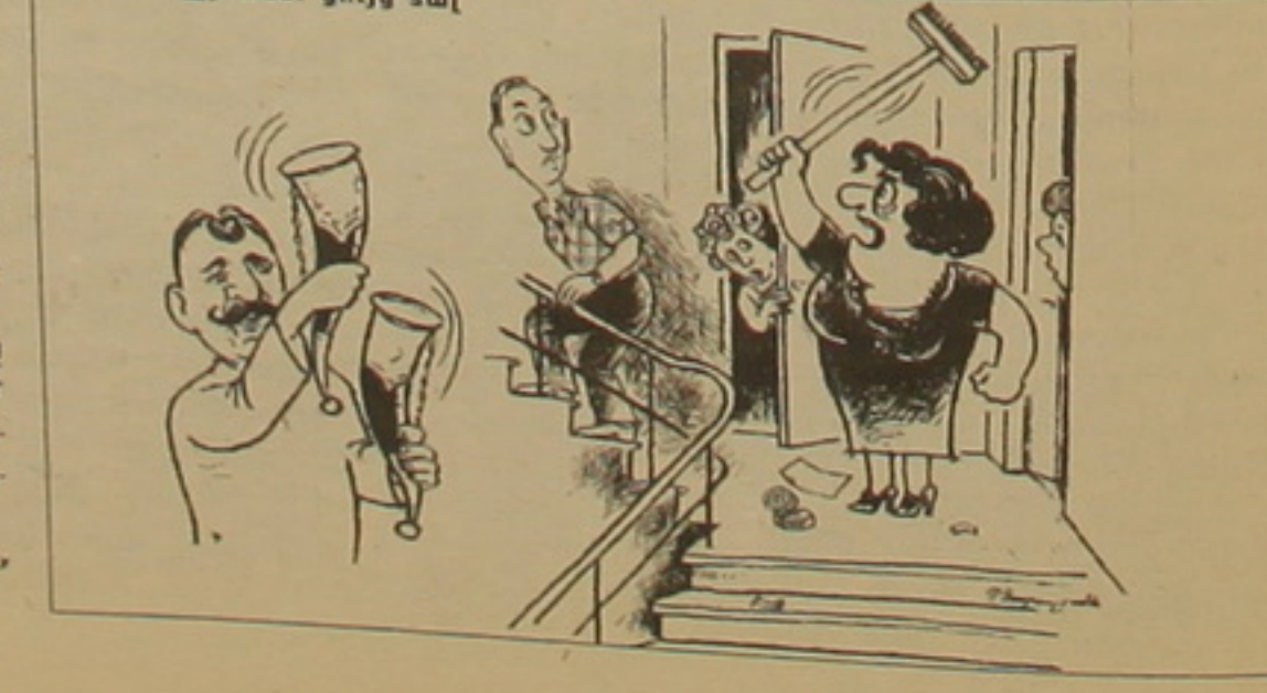
Երջյուններ ցույց տալ