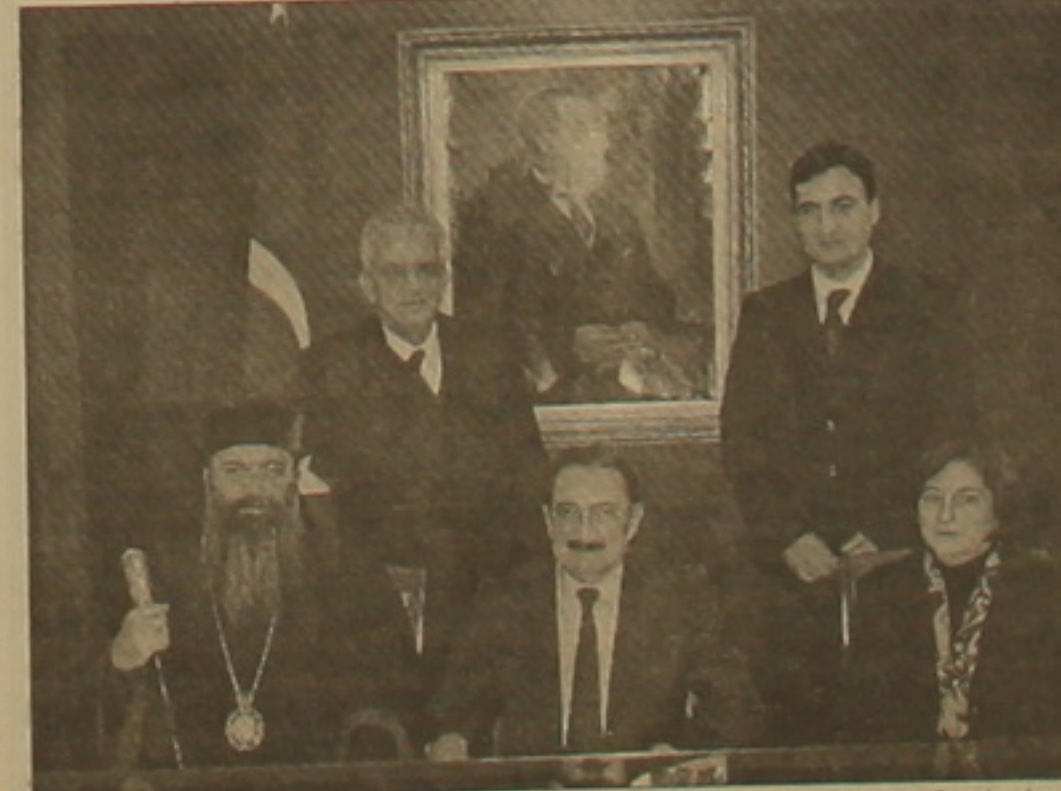
դես ննարկման փուղում է, եւ նրա մեակման ընթացքում հաեղի կառնվեն կրոնական փոհրամասնությունների Ետակեցները:

ԱՆԿԱՐԱ, 14 ՀՈՒՆՎԱՐ, ՄՐՏԵՆՊՐԵՍ: Թուրքիայի վարչադեսն էղեիթը ընղումնել է Կ. Պոլսո Հայոց դատարի Մեհրող արեղիսկղողոս Մուրթաֆյանին, որն իր մտահողություններն էր հայտնել ազգային փոհրամասնությունները ներկայացնող համայնների անԵարձ գույի իրավունների վերաբերյալ դատարան-վող օրինագծի կադակցությամբ: Հայոց դատարիարը կարծի է հայտնել, որ փոհրամասնություններին դիտի Երվեն նույն իրավունները, ինչ ունեն թուրքերը, որը կվերացնի մինչեւ այժմ գոյություն ունեցող իտրականությունը մահնեղական եւ ոչ մահնեղական համայնների միջեւ: Ըստ Ասամրղում լույս Ետանղ «Մարմարա» օրաթերթի, վարչադեսն իր հերթին փատեղ է, որ փոհրամասնությունների գույլային իրավունների մասին օրինագիծը