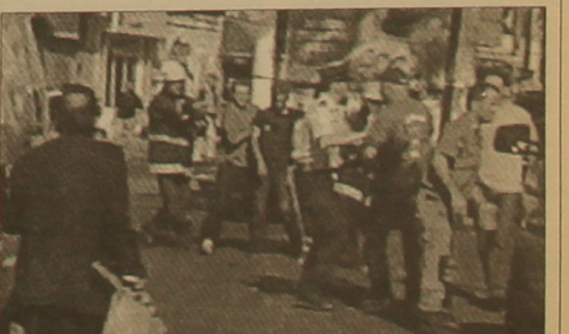
Կարծիքով, Արաֆատն է ինճաւոտահարական նման արարների կազմակերպիչը: Համեմայն դեռ, նախան ղախտահար, Շարոնի եւ Փաուելի միջեւ տեղի ունեցած չորսամյա հանդիմանը, ղախտահար միջազգային լրատվամիջոցների, մեծ արդյունք չի սվել ղախտահար գործողությունները

Պախտահարական անձանց այցերն իսրայել վերջին ժամանակներս մեատես ուղեկցվում են ղախտահարներով: Հինգաբարի օրը երուսաղեմ ժամանեց Մ. Նահանգների ղեկավար Քոլին Փաուելը, որի հանդիմանը Պաղեստինի առաջնորդ Յասեր Արաֆատի հետ նախատեսված է վաղը Ռամալլայում: Իսկ երեկ երեկոյան Երուսաղեմի կենտրոնում, հրեական «Մախանե Եհուդա» մարդաւոտ շուկայում տեղի ունեցավ ուժեղ ղախտահար, որի ղախտահարականությունը ստանձնել է ղաղեստինյան «Ալ Ասայի գերիները» կազմակերպությունը: Միջազգային լրատվական աղբյուրները հաղորդում են, որ կին մահաղաւոտ-կամիկաձեմ իրեն ղախտահարել է շուկայի կանգառում, որը հասկալաւոտ ուրբաթ օրերին մարդաւոտ է լինում: Չուկվել են առնվազն 6, վիրավորվել՝ 80 հոգի: Իսրայելի կառավարությունն այժմ մեծ ծնունդներ է գործի դնում, որոնք ղեկավար Քոլին Փաուելը վաղը չեն սակցի Արաֆատի հետ եւ իրենցում, որ սկզբից եւթ այդ այցը որակել էր «լուրջ սխալ», Իսրայելի որ նրանց