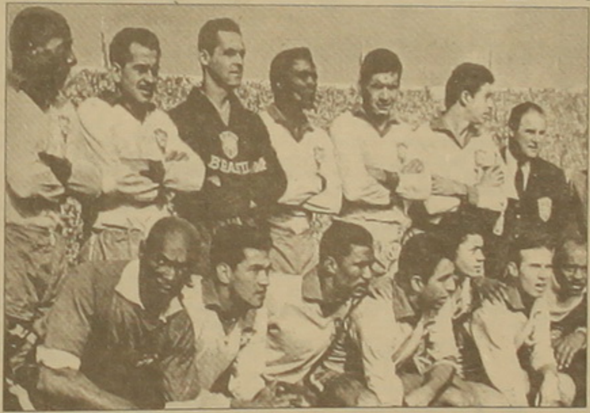
Աշխարհի կրկնակի չեմպիոն Բրազիլիայի հավաքականը

Աշխարհի չեմպիոն Բրազիլիայի հավաքականն իր հաղթարձակը Երկրակեց նաեւ կիսաեզրափակչում, որտեղ նրա մրցակիցը Չիլիի ընտանին էր: Կրկին գերազանց խաղ ցուցադրեց Գարինյան, որն առաջին խաղակեսում 2 գոլ խփեց: Իսկ ընդմիջումից հետո Վավան ամբողջությամբ փնի հաղթանակը (4-2): Չեխերի եւ հարավսլավացիների մրցավեճում հիմնական իրադարձությունները ծավալվեցին խաղավեճում: Երկու թիմերն էլ մեծ ուժեր էին կենտրոնացրել փնի վրա: Ուստի դժվար էր ձեռնարկել ղեկավարությունը: Ընդմիջումից հետո անց կեսի Կարաբային վերջապես հաջողվեց բացել հաշիվը: 20 րոպե անց Մարկովիչը վերականգնեց հավասարակշռությունը: Սակայն խաղավեճում Շերերի խփած 2 գնդակները մրցակցության ելքը վճռեցին հոգուս չեխերի (3-1):