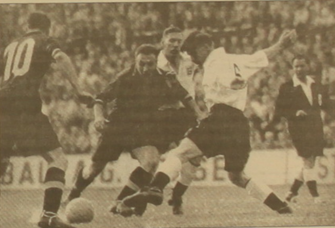
Պրվազ Անգլիա - Բելգիա նախնական փուլի հանդիպումից:

Ֆուտբոլի աշխարհի 5-րդ առաջնությունը անցկացվեց 1954 թ. ամռանը Հվեյցարիայում: Առաջին անգամ խաղերը հեռարձակվեցին հեռուստատեսությամբ: Առաջնության մրցակարգը կրկին փոփոխվեց: Մասնակից 16 հավաքականները բաժանվելով 4 խմբի, 3-ական խաղի փոխարեն 2 հանդիպում էին անցկացնում: Նախադաս խմբերում որոշել էին երկու ուժեղագույններին, որոնք մեծ է մրցելու մյուս երկու մրցակիցների հետ: Այդ խաղերի արդյունքներով էլ որոշվելու էին ֆառորդ եզրափակիչի մասնակիցները: Հավասար միավորների դեպքում անց էր կացվում լրացուցիչ մրցախաղ: Նոր մրցակարգը խստորեն խնայողացվեց մասնակիցների կողմից: Հանդիպումներն էլ ցույց սվեցին, որ ռազմապետական խմբերում առաջատար թիմերի ընտրությունը սխալ էր կատարվել: