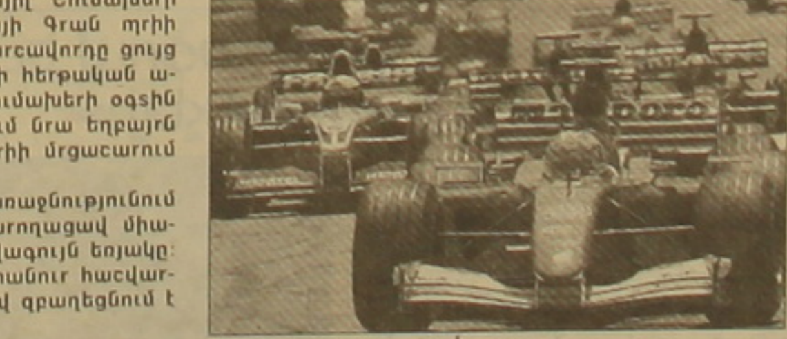
Միխայիլ Շումախերը Գրան Պրիի խաղարկության հաղթանակով:

Ալբարտի բազմակի չեմպիոն Միխայիլ Շումախերի հաղթանակով ավարտվեց Բրազիլիայի Գրան Պրիի խաղարկությունը: Գերմանացի ավտոարեավորողը ցույց տվեց լավագույն արդյունքը: Ալբարտի հերթական առաջնության հաշվարկով Միխայիլ Շումախերի օգտին գրանցված է 24 միավոր: 2-րդ տեղում նրա եղբայրն է՝ Ռալֆը (16 միավոր): Նա Գրան Պրիի մրցաշարում էլ 2-րդ ցուցանիշն ունեւ: