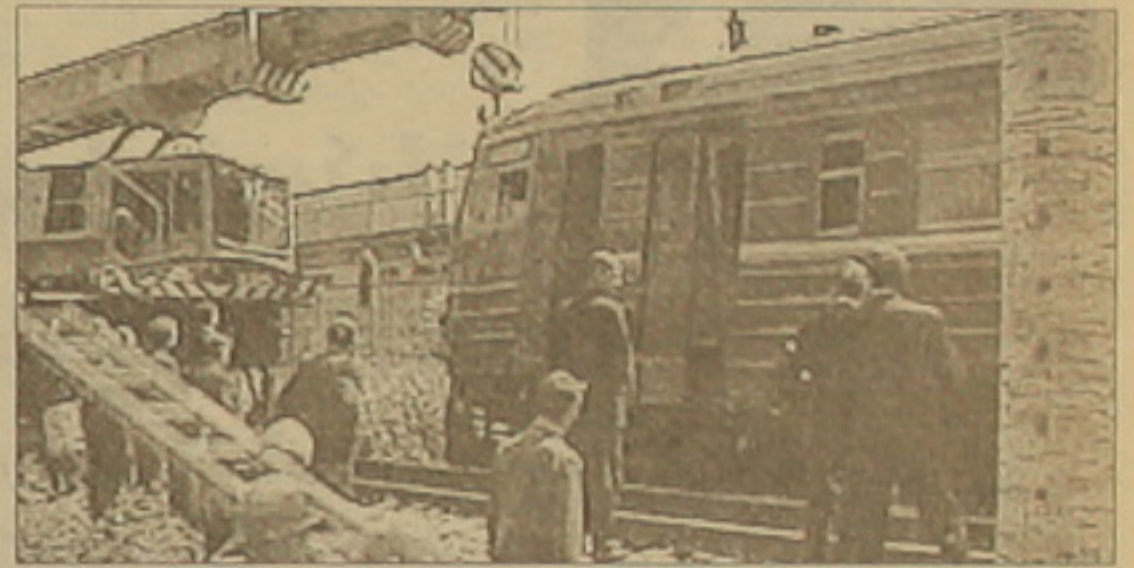
Ինչ է վրավորներ լկան:

ծառայության սեղեկությունների համաձայն, նախօրեին Քելախորայի քաղաքում տայթեցվել է բեկոսար ավտոմեքենա: Վկայակոչելով նախաճանաչության սվայները, լուսնական Սուխումը ղեկավարում է, թե ինչպիսի քոլոր հանցագործություններն ահաբեկչական ֆայթեր են, որոնց համար լուսնական ժամանակով ժառայությունների ղեկավարությամբ գործող ահաբեկչական կազ-