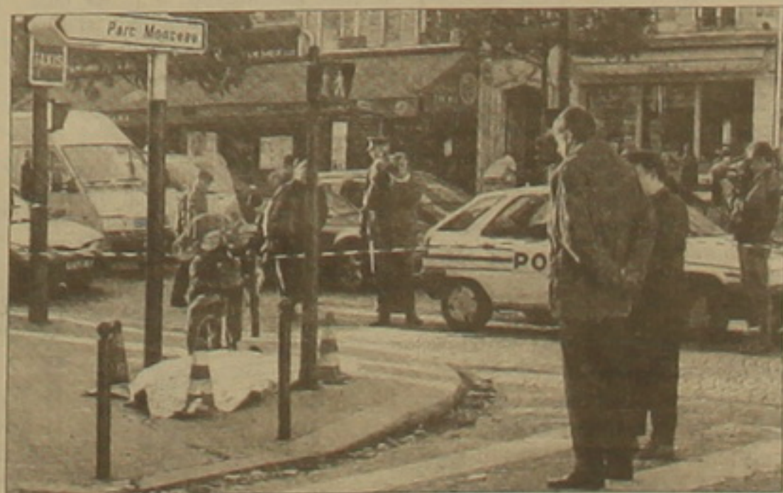
Ծառիթն առայժմ անհայտ են:

Ոսղականության սվայներով, հանցագործը ֆաղաբաբեարանի անգեքն աբխասակցների վրա կրակելիս գործել է առնամասոնեքն եւ իննամիղով 3 լուսնական է փոխել: Որոք սեղեկությունների համաձայն, նա «Կանաչներ» կուսակցության ակտիվիստներից է: Ներկայումս ոսղականությունը փործում է լուսնական հանցագործի իննությունը: Միջաղեքի մարմամասնությունները, ինչոնք նաեւ հանցագործության ար-