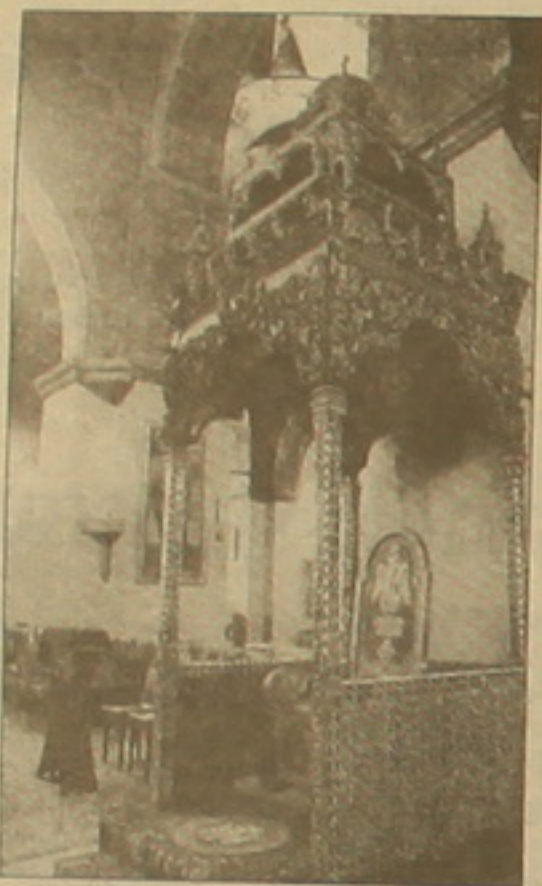
ազակերների ոսֆեր: Ավագ Հինգուրթի, իսկառնան գիտերը 19:30-ից մինչե՛ւ ուշ գիտեր կկատարվի իսկառնան կարգ՝ ի հիշատակ

Հետադարձին ժամը 16:00-ին կատարվելու է Ոսնկանի կարգ հանդիսանությունը Ն.Ս.Օ.Տ.Տ. Գարեգին Բ Ամենայն Հայոց կարողիկոսի: Արարողության ընթացքում կօրհնվի յուրը եւ աղայ Բրիտանիայի օրհնակով Վեհապետ Հայրապետ օրհնված յուրով կօծի 12