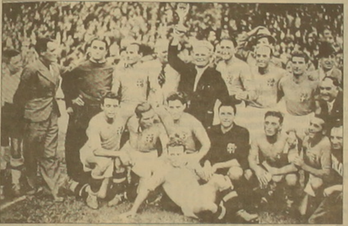
1938թ. աշխարհի չեմպիոն Իսպիայի հավաքականը եզրափակիչ խաղից հետո

Կիսաեզրափակիչում առավել մեծ հետաքրքրություն էր առաջացրել Իս-պիայի և Բրազիլիայի հավաքական-ների մրցավեճը Մարսելում: Հետաքր-քիր է, որ վստահ լինելով իրենց ու-ժերին, բրազիլացիները նախադե-րժանությամբ էին Մարսել-Փարիզ միակ ավիափոխակի տնտեսը: Այնուամենայն-սակայն, հաղթանակի դեմում իսպացիները ստիպված էին լինելու եզրափակիչ խաղի համար Փարիզ ուղևորվել զնայցով: Իսպացիների մարզիչ Վի-տորիո Պոցցոյի բանակցությունները բրազիլական կողմի հետ ավասու-մեր կիսաեզրափակիչում հաղթած թիմին տրամադրելու վերաբերյալ ա-ղադրում անցան: Այս փաստն ավե-լի զգուշացրեց իսպացի ֆուտբոլիստ-ներին, որոնք որոշեցին մի լավ դաս տալ գոռոզ բրազիլացիներին: