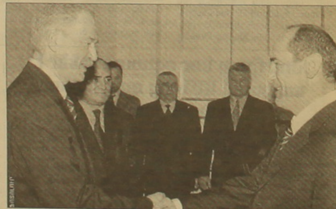
Բորիս Գոիզովին երեկ ընդունեց նախագահ Ռոբերտ Զոյարյանը: Այս կառակցությամբ նեց, որ բնարմիջոցների աղբիլի Երեւանուրյան առնչվող հարցը ԵՄ կլննարկվի նիստում:

Քննարկման Երեւանակում ներառված են նաև ԵԳ նարմիների կողմից օդերաշիվ միջոցաուումների ընթացում կիրառվող հասուկ տեխնիկա և զինասեսակների նոր նմուշներ Հայաստան առաքելու և կարգերի վերաստասման հարցերը: ԱՄՆ-ի դեպարտասմենտի 2001թ.