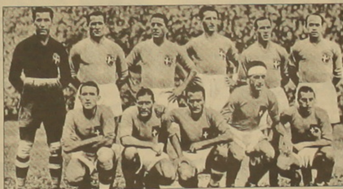
1934 թ. ախարհի չեմպիոն Իսպանիայի հավաքականը

Կիսաեզրափակիչ մյուս խաղում, չնայած սեփական դաշտի գործոնին, մասնագետները նախադասվությունը իսպանիայի ավստրիացիներին, որոնք իսպանացիների հետ նախորդ 13 հանդիպումներում միայն մեկ անգամ էին զիջել: Սակայն ավստրիացիները չկարողացան արդարացնել սղասելիքները: Խաղասկզբում Շինդելարժը, Շալը եւ Յիլեկը չօգտագործեցին նոյախաղի ռախեղը, իսկ 40-րդ րոմեին Յոզեֆ Բիցանի հարվածն իր վրա ընդունեց դարձաբաստի ծողը: Իսկ խաղում միակ գնդակը կրկին մրցավարական կողմնակալության արդյունք էր: 19-րդ րոմեին Մեացան Սկյավիոյից փոխանցում սասնալիս գտնվում էր խաղից դուրս» վիճակում: Սակայն