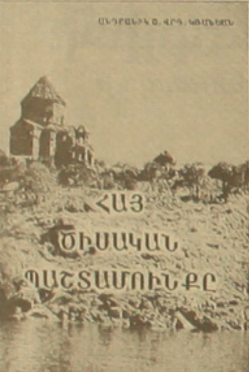
ՄԱՐՏ 2002 ԷՐ 6

Հասարակական գիտությունների մասին (էջ 7-9) Գ. Կոստանյանը գրում է. համար «առձեռն» ժամասացությունը մշակելով (էջ 161): Երրորդ մասը էջ (165-195) նվիրված է Գայր եկեղեցու դասախոսին: Ներկայացվում են բացատրվում են դասախոսի խորհուրդը, Գայր եկեղեցու դասախոսի գաղափարները, դրանք հասարակությանը, բուն դասախոսի ծիսակատարության ընթացքը՝ սկզբից մինչև վերջ: