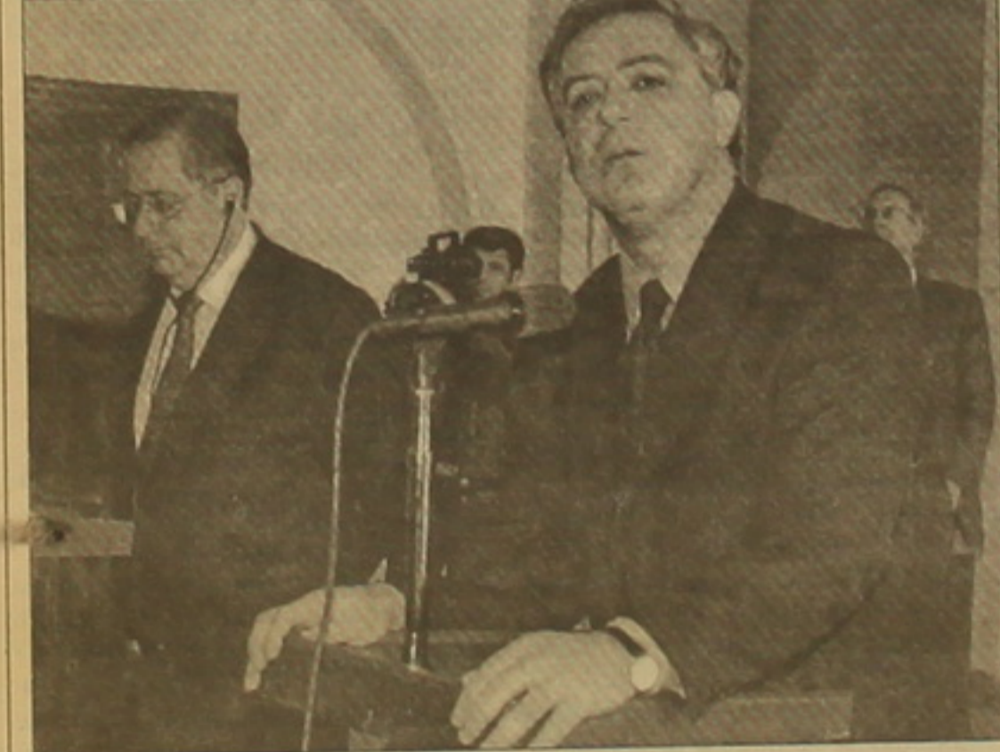
Տեւ էջ 3

Սուխումում ղեկում են, որ Վրաստանը ղաթեանական է ղաթեանական