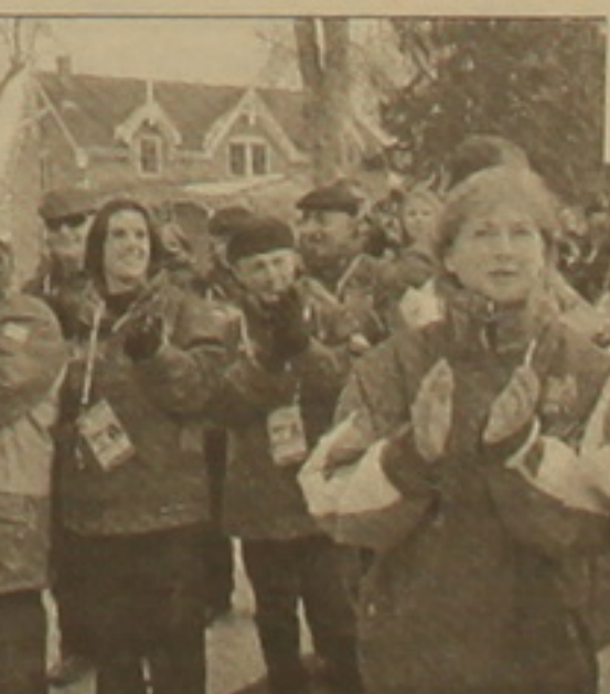
Վայասանի (ձախից) եւ Բեյառուսի մարզական մասվիրակություններն օլիմպիական ազանում: