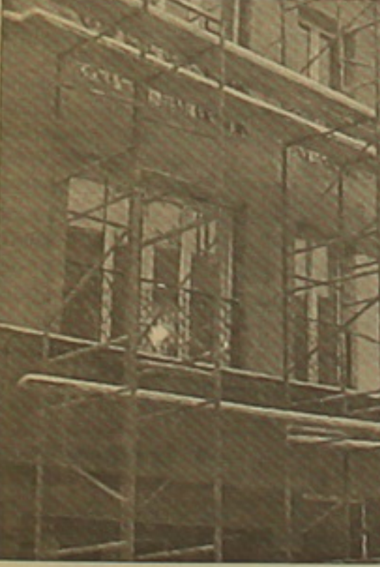
«Եվրոպան» շինարարության ընթացում

Հայաստանը ներդրումների համար ռիսկային գոտի չէ, նույն է Լեւոն Բաղդասարյանը, ավելին՝ ծավալած գործունեությունը («Սաբերասուր-Սեւան» սուրիսական գործակալություն) ընդլայնելու նպատակներ ունի՝ խթանելով սուրիզմի զարգացումը, ինչը նաեւ հայկական միջազգային ավիաուղիների ծրագրային ֆազակացության մաս է կազմում: Լեւոն Բաղդասարյանը Երևանի կենտրոնում կառուցվող 3 աստղանի «Եվրոպա» իյուրանցի շինարարությունը նպատակադրված է ավարտել մինչեւ 2003 թ. մարտ մինչը: Ըստ Լեւոն Բաղդասարյանի, կրամադրվի բարձր սղասարկում եւ այնուհետ գներ, որ ֆազակերեն գրաստեղծությունը: «ՀՄԱ-ի» գլխավոր սնորհին ուղղված հարցին՝ արդյո՞ք «Արմենիա» օդանավայանի կողմից կփոխհասուցվե՞ն Երևան-Փարիզ Վերըի ուսացման դասճառով ավիաընկերության կրած վնասները Վերսանդ Հակոբյանը