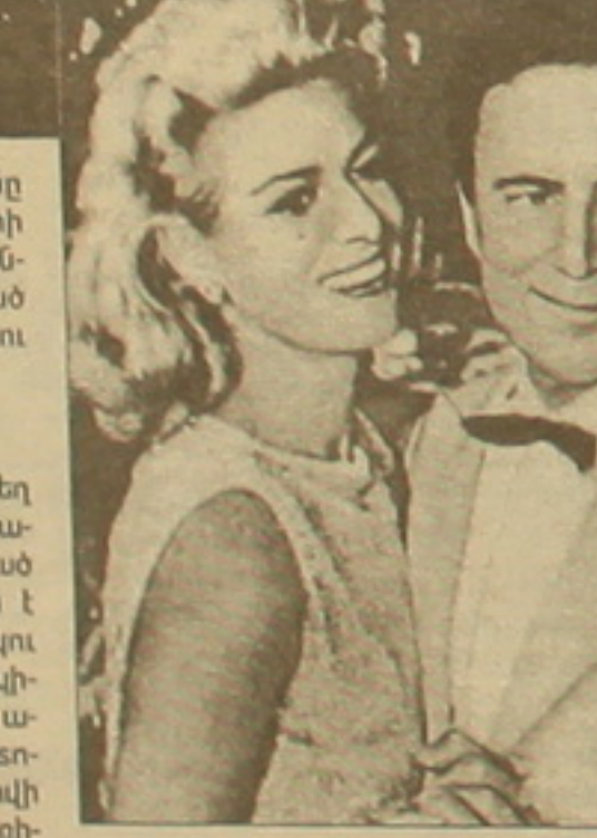
Արգենտինական կինոյի լեգենդար սիլիկը 70-ականներից ի վեր արդեն կազմակերպվեց Լոնդոնի բարերից մեկում (ննջեցյալը խնդրում էր սեր ու-

Սեյիկայում նկարահանվող Ռասել Բոուն մոտ 9 հազար կմ էր կրել իր հարգանքի վերջին տարի Բիլլի Գրեյի համար, որը 72 տարեկանում վախճանվեց ֆաղցկեղից: Նրան բարեկամացել էին «Գլադիատոր» ֆիլմի նկարահանման հրապարակում, որտեղ Գրեյը հայրաստատության զոհը դարձավ հոստիացի կայսր էր: Նախավոր իռլանդացու հոգեհացը, որ կազմակերպվեց Լոնդոնի բարերից մեկում (ննջեցյալը խնդրում էր սեր ու-