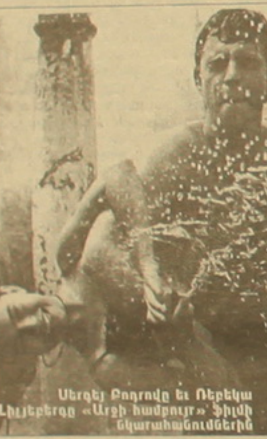
Սրայգե Բողոսյանի և Ռեբեկա Լիլիերի «Արջի համբույր» ֆիլմի նկարահանումներից

մի անգամ տեսելուց հետո ընդմիջ մեխվում են հիշողությունները մեզ: Քեթրին Մայլ Լիի սիրելին էր է նկարահանվել է նրա չորս ֆիլմում: Բարբիլից վերջին դերերն էին անտակ Սեյ ԱՆՆԻՆ Գյուլ Եղբայրների «Դոխիկ»-ը քիլերում էր Բուենայից հեռուստատեսային ռեպորտաժներ վարող ղեկավար լրագրող Դանիա Տանովիչի «Ոչ մեկի հողը»՝ սրագի ֆարսում, որն այս օր արժանացավ «Օսկարի» ու մի խուրձ այլ մրցանակների: