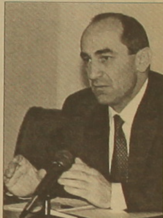
այանը: Շարունակելով «հավանաբար» մոտեցումը՝ այս անգամ Ռոբերտ Բոչարյանի նախընտրական ցաքի ղեկը կլինի Պաշտպանության նախարար Սերժ Սարգսյանը: Ի դեպ, այս կարգավիճակի հավակնորդները ցածր են:

Նախորդ ընտրարժանում Բոչարյանի նախընտրական ցաքը դեկավարում էր Վլադիմիր Մովսի-