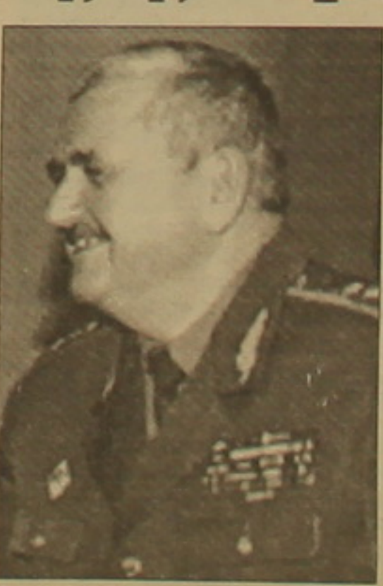
համաձայնագիրը: (2002 թ. հունիսի 6-ին Մինսկում ստորագրված

Բելառուսի լուսնագրքում նախարար, գեներալ-գեղադատ Լեոնիդ Մալցեյը վստահ է, որ Հայաստանի եւ Բելառուսի ռազմատեխնիկական համագործակցությունը կբարելավվի: Այդ մասին նա լրագրողների հետ զրուցելիս հայտարարեց Երեւանում, ուր ժամանել է երկուրդ լուսնագրքում այցով: Երբ խոսքերով, «երկու լուսնագրքերը ներկայումս մարտական հերթափոխություն են իրականացնում ԱՊՀ հակաօդային լուսնագրքում միացյալ համակարգի ցրանակներում»: Գեներալը նշեց, որ երկու լուսնագրքերը ռազմական ոլորտում արդեն իրավաբանական հիմք են: Լ. Մալցեյը նշեց, որ իր մեկնումից առաջ Բելառուսի խորհրդարանի ստորին լուսնագրքը վավերացրել է ռազմական տեխնիկայի փոխադարձ մասկարաբանությունները վերաբերող հայ-բելառուսական