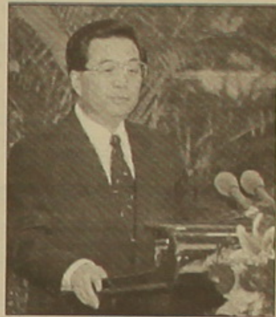
Պի բազմաթիվ ներկայացուցիչներ արդեն ֆանի արի կարեւոր պաշտոններ են զբաղեցնում: «Դա նշանակում է, որ Ցզյան Ցզեմինը լիարժեք դադարեցրել էր իր անձնական ազդեցությունը կոմպարտիստների վրա, եւ նախկին իշխանավորները որոշակի ազդեցություն կապահովեն», ասում է նա:

Ինչպես եւ ստասվում էր, երեկ 59-ամյա Հու Ցզինսաուն ընտրվել է Զինասահի կոմկուսի գլխավոր ֆուրսուդար՝ այդ պաշտոնում փոխարինելով 76-ամյա Ցզյան Ցզեմինին: Վերջինս դադարեցել է բանակի գլխավոր հրամանատարի պաշտոնը: «Միասնականության ոգով» անցկացված ԶԿԿ 16-րդ համագումարի աշխատանքը հաջողված համարելով, Հու Ցզինսաուն իր ելույթում ընդգծել է, որ Ցզյան Ցզեմինի «կարեւոր գաղափարը» կառուցապահներին թույլ է տալիս մոտիվ գործել կուսակցությունը: «Մենք հուսալիք չենք անի ամբողջ կուսակցությանը եւ ժողովրդին», ասել է նոր գլխավոր ֆուրսուդարը: