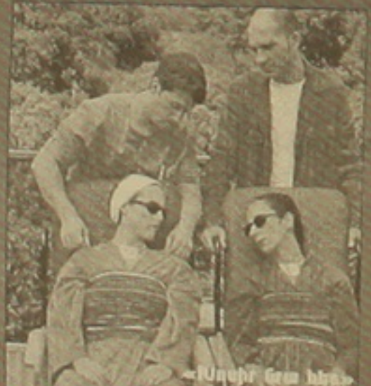
«Մարիուսը և ժաննեթը»

Ֆինն Ալի Կաուրիսյակին, իսպացի Մարկո Բելոկկին, բրիտանացիներ Քեն Լոուչն ու Մայլ Լին, ռուս Ալեքսանդր Սոկոլովը այս տարի իրենց վերջին գործերով ներկայացան Կանոնի փառատոնում, իսկ անգլիացի Փոլ Գրինգրասն ու ֆրանսիացի Ֆրանսուա Օզոնը՝ Բեռլինում: Դենց այդ գործերն էլ առաջադրվել են կինոակադեմիայի հիմնական մրցանակներից: Լավագույն ֆիլմի դափնիների համար կոպիտաբեն Կանոնի մրցանակակիրներ Պոլանսկու «Դառնակահարը» և Կաուրիսյակի «Առանց անցյալի մարդը», բեռլինյան «արջերի» արժանացած Գրինգրասի «Արյունոտ կիսկին» և Օզոնի «Ութ կինը», ինչպես