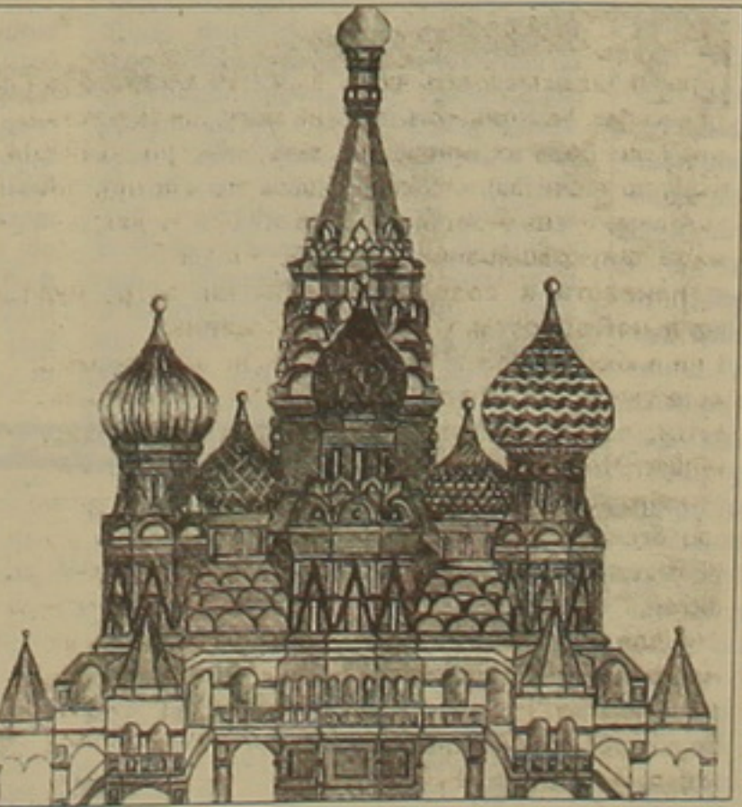
Այսպիսին է լինելու թուրքական «Կրեմլը»

Հինգ աստղանի հյուրանոցները մեծ մասամբ նման են իրար. մոսկովյան Մոսկովյան Բարձր զինված են, ճկված ոտներով իսպանական կահույք, թանկարժեք սանսեխնիկան եւ բարեկիրք անձնակազմը: Այգելուները համախ ղեկավարում են ընտրություն կատարել նման հյուրանոցների միջոց: Այժի ընկնելու եւ հյուրերին գրավելու նույնպես կոլլիսները երբեմն դիմում են ներկայումս մոդայիկ դարձած էթնիկական թեմային: Մոսկովյան կենտրոնում վերջերս բացված «Արարատ Թուրքական Մոսկովյան» հյուրանոցի մասին «Ազգը» ժամանակին գրել է: Հինգ աստղանի այդ հյուրանոցին անդրադարձել են նաեւ մոսկովյան թերթերը: «Նեգալիսիմայա զագեթան», օրինակ, նույն է, որ «Hyatt International» ցանցին լրատվամիջոց «Արարատ Թուրքական Մոսկովյան» կառուցված է ըստ հայկական թեմաների: Առաստիակական «Արարատ» ռեստորանի տեղում «Լուսին» հայկական կոնցերտի ուժերով