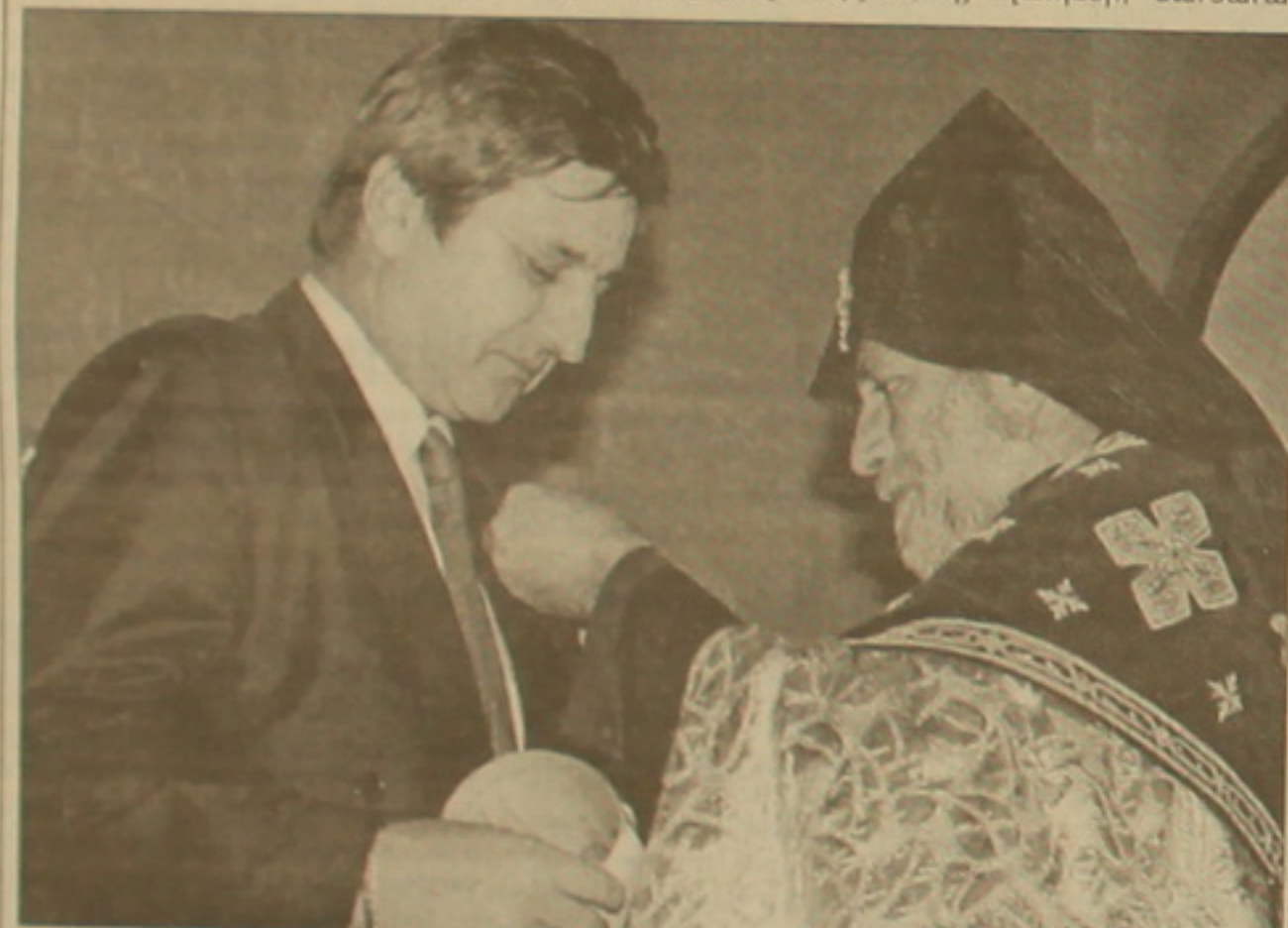
Վեհափառ «Գր. Լուսավորիչ» ցանցում է շնորհում բարերարին:

Սբ. Գեորգ գորավարի անունով կառուցված եկեղեցին սարածաօբանում առաջինն էր, որ դարձավ հավասարապես հայերի ուխտատեղի: Մինչև ու շատ տեղեր արարողությունից հետո նորաբաց Սբ. Գեորգ եկեղեցուն մասնակցեց առաջին սուրբ Պատրիարքը, իսկ բախում տեղանների վրա հացն ու զինն էին և օրհնված մասաղը: