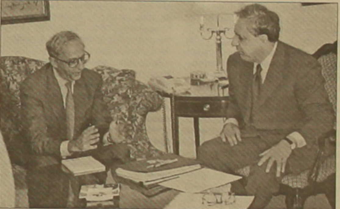
ԱԳՆ հասարակայնության հետ հարաբերությունների վարչությունը, որն ժակոլենի այցը Հայաստան նպատակ ունի անմիջականորեն ծանոթանալու Լեռնային Ղարաբաղի հիմնախնդրի կողմերի մտեցումներին:

Հանդիպման ժամանակ կողմերը Լեռնային Դարաբաղի հակամարտության խնդիրն իր ողջ խորությամբ, վերջին զարգացումները, երկու նախագահների միջև ուղիղ երկխոսությունն ու դրա արդյունքները: