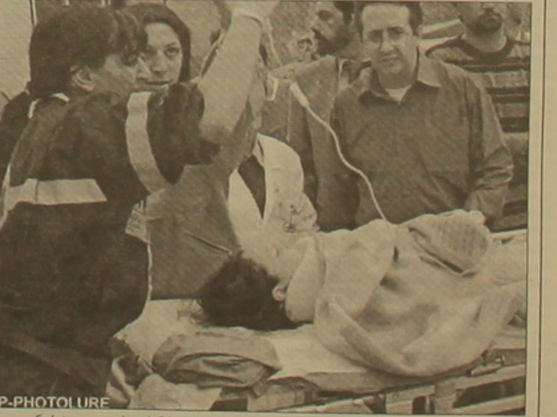
կա, այն էլ դորրից ցեմը, որը 50 տարի առաջ կառուցվել է կառավարության միջոցներով: Հետեւաբար, անորակ շինարարության համար ժողովուրդը արղարացիրեն կառավարությանն է մեղաղրում:

Առաջինից 30 ժամ հետ, երեկ երկրային, երկրաւարժ կրկին ցնցեց Հոնոլուլուի հարավ-արեւելում գտնվող Ման Ջուլիանո դի Պուլիո ֆաղաբ նոր ավերածություններ ղարտառելով: Նախորդ զիջերը ֆաղաբի փողոցներում անցկացրած բնակչությունը, որը ցերեկը հանընդհանուր հուզմունքով հրաժեց էր սվել նախորդ օրվա 27 զոհերին, նորից խուճաղի մասնակցեց: Այս, երեկ գրել էին, որ նախնական սվալներով զոհերի թիվը 5-ն է, սակայն ավելի ուշ, երբ փրկարարներին չհաջողվեց փլված դորրի փլասակների սակից աւակերտների մի մասին ազատել, զոհերի թիվը հասավ 27-ի, որոնցից 25-ը դորրոցականներ: Երեկ կեսօրին Ման Ջուլիանո ժամանեց Իսպանիայի վարչաղես Բելուսկոնին, որին ֆաղաբի բնակիչները ղարտույթով դիմավորեցին: Բան այն է, որ ֆաղաբում տմբողջովին փլված ընդամենը 1 ցեմ