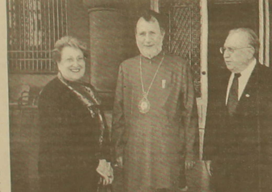
Սի Բանի օր առաջ հոկտեմբերի 19-ին ԵՍ ԵՍ ԵՍ Ազատյաններին ընդունելը՝ Ամենայն հայոց կաթողիկոս, Ն.Ս.Օ.Տ.Տ. Գարեգին Բ.

Երբևէ անգամ այս հարցի մասին խորհելիս ես ուղղակի զարմանում եմ: Մենք երբեմն դա-հանքներ ենք դնում, նաեւ ինչ-որ սեղ խոսվում ենք: Ու ամեն ան-գամ փորձում եմ դարձել, թե մայր հայրենիքում աղոթող Բանի մեծահարուստ է (ուճեմ, չէ՛), այդ-