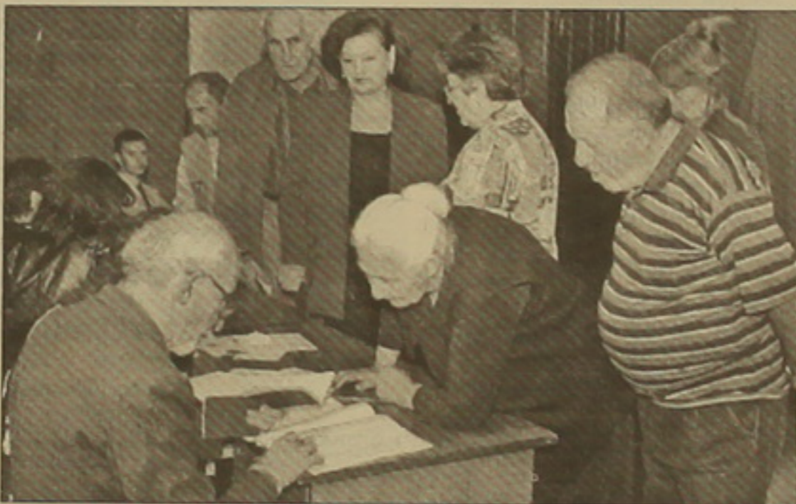
Կոնգրեսի անդամները ընտրությունների ընթացքում կոնգրեսի ղաժվարության ղեկավար Քրիստֆեր Նյուրբիին:

«Կոնգրեսի ղաժվարությունը դաժալ, որ տեղական ինքնակառավարման մարմինների ընտրություններն արտացոլել են միջազգային չափանիսներին համադասարարանեցվելու ցանկությունը», այոախի Մախնական գնահատական է տրված Եվրախորհրդի տեղական եւ տարածային ինքնակառուցման կոնգրեսի ղաժվարության զեկուցում, որը տեղի հրավիրած մամուլ առուխում ընթերցեց ղաժվարություն ղեկավար Քրիստֆեր Նյուրբիին: