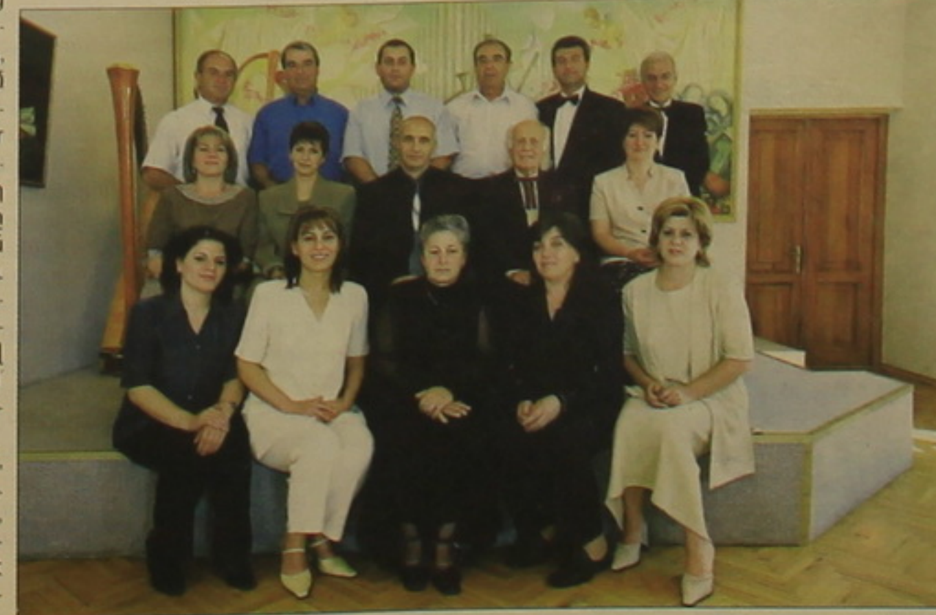
Երաժեսանոցի ուսուղչական կազմը:

Ղասասխանը զյումրեցիների սրսարլիս ծափողղույններն էին: