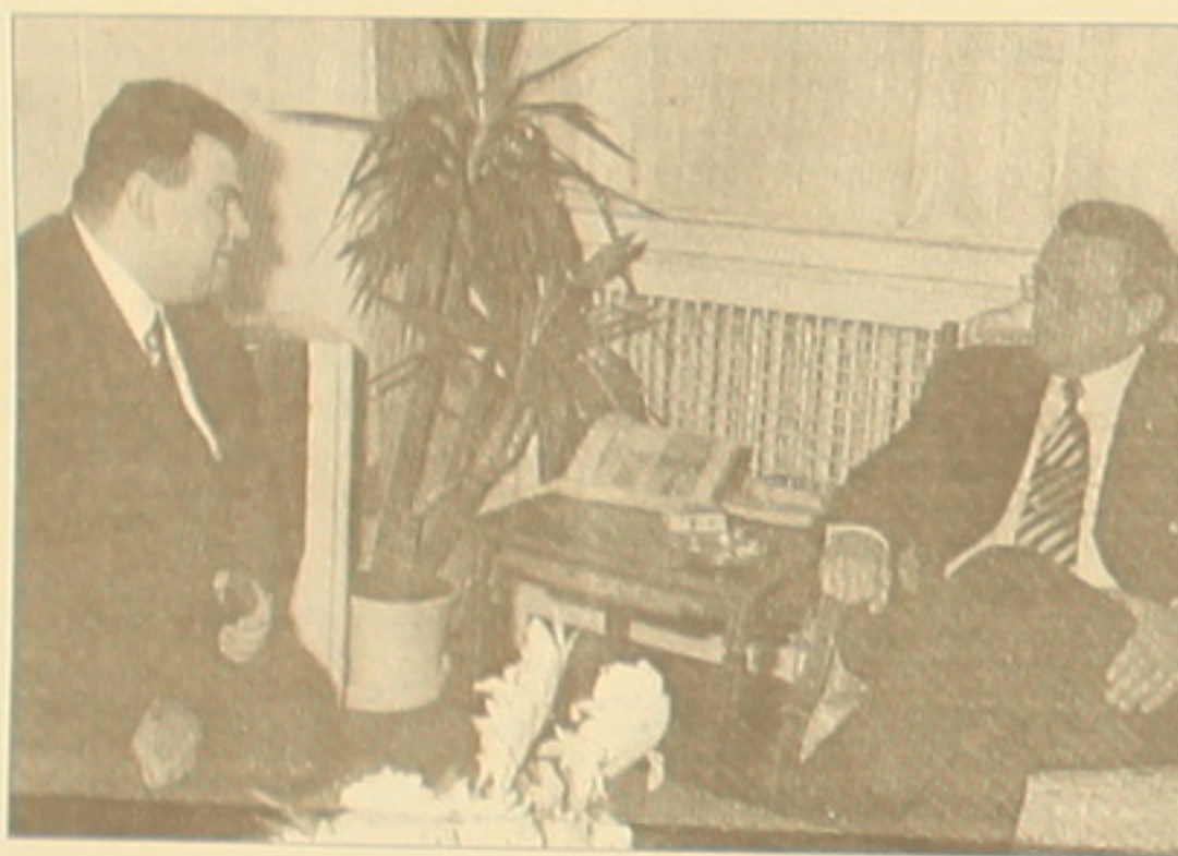
Լու է առկա դժվարությունների վերացմանը:

Պոլսահայ վարժարանների հիմնախնդիրների առնչությամբ Յըլմազն ասում է. «Անհրաժեշտ է փոփոխություններին դաս-