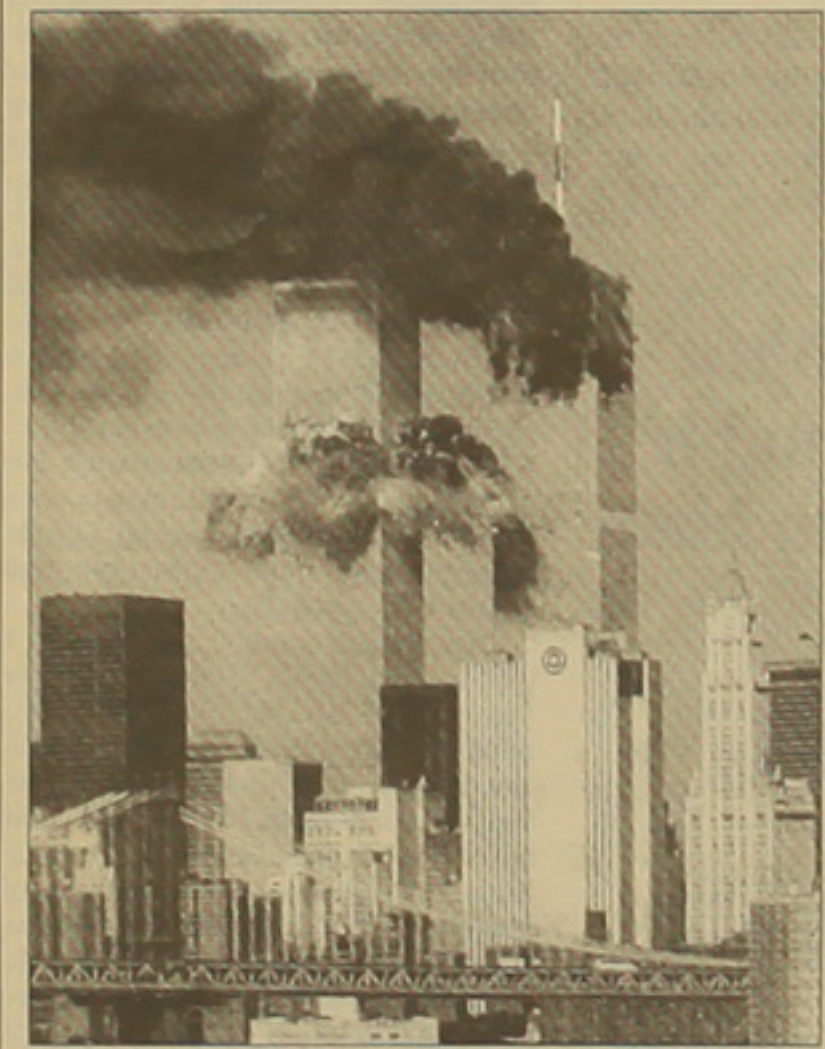
Այսօր ողջ մոլորակում կհնչի Մոցարտի «Ռեվիլիեթ»-ի հիմնական սեպտեմբերի 11-ին ԱՄՆ-ում ահարեկչական ակտի մեկամյա տարեկիցի:

«Ահարեկչների հազարավորում անասելի բռնության եւ ահարեկչության, զանգվածային սպանդի ահավոր ակտն ԱՄՆ-ին կհարկադրի հեռանալ աճառիի աստարեկից: Նրան սխալվել են: Նրան կարծում էին, թե այլ ղեկավարներն էլ, իրենց դեմ նմանատիպ հարձակումների ստանալիս ազդեցության տակ, միայնակ կթողնեն Ա. Նահանգներին: Նրան կարծում էին, թե անգի անցյալում կարողացել են խուսափել արհադատությունից, աճառիին աղապայում էլ ձեռնարկի կմնա իրենց թուլասրելով անդադի շարունակել ճողկալի հանցագործությունները: Նրան սխալվել են», երկ հրավիրած մամուլ ասուլիսին նեց 33-ում ԱՄՆ դեսպան Ջոն Օրդուեյը: Նա տարեկիցի առթիվ ղառաստած իր ճառում ամիցս շեշտեց, թե ահարեկչներին չհաջողվեց մեկուսացնել ԱՄՆ-ին, իրենց երկիրն, ընդհակառակը, աճառիի շարունակությունների հետ սկսեց համագործակցել Աֆղանստանում «Ալ Ղաիդայի» բազաները ոչնչացնելու համար: Դեսպանը, նեցելով, թե ահարեկչության դեմ ղայքարը դեռ չի ավարտվել, տեսակետ հայտնեց, թե հնարավոր է երբեք չավարտվի էլ: