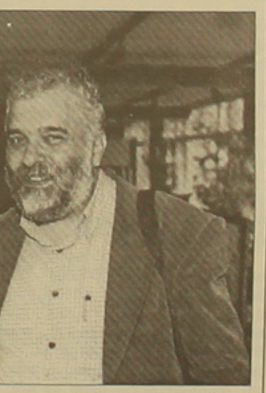
Նեղինակը և Ռուսոյի Զարաբույուն

թյուն թե մեկնաբանություն, գեղատարանության վերաբերյալ որեւէ գրանցումներ չի կատարում: Մենք գեղատարանության հասկացության անընդունաբար բարդությամբ չունենք: Կարելի է եղբայրական հայ ժողովրդի դասական ողբերգությունը անվարան արհեստագործել, ներողություն խնդրելու և փոխհատուցման հարցեր բարձրացնել, ինչը ազգային է անձամբ անել: - Ինչո՞ւ են գնահատում հայ-թուրքական հարաբերությունների ներկայիս վիճակը: - Անկախ արդյունքից, կողմերի որոշակի Եվրոպայի առկայությունը դրանց իստատ քաղաքացիությունից անհամեմատ նախընտրելի է: Ինձ համար դասական կամ կիսադասական Եվրոպայի առկայությունը ավելի կարևոր են մարդկանց և ժողովուրդների Եվրոպայում: Գաղտնի չէ, որ դասական կամ կիսադասական Եվրոպայի առկայությունը որեւէ առաջընթաց չի արձանագրում, որովհետև մասնավորապես փոփոխություն է անհրաժեշտ, իսկ հորիզոնում դեռևս փոփոխության նախաձեռնում չեն երևում: Որքան էլ դասական գիրկն անցնի, այսօր չի կարելի արդարացնել և օրինակաբանել որեւէ դասական իր փոփոխությունների նկատմամբ կատարած անարդարությունն ու բնաջնջման փայտը, ընդ որում առանց արքայազնի կամ արքայի, զորավարի, ժողովրդի, երիտասարդների: Որոշակի ժողովրդի արհեստները այն սարածից, որտեղ սա հազարավոր արհեստ գոյատևել է, չի կարող իրավական և օրինական հիմք ունենալ: Ես կարծում եմ, որ առանց այդ իրողությունը դասադարձի և անհար և ծավալել իրական և անկեղծ որեւէ երկխոսություն: Չեմ կասկածում, որ դասադարձն այս փայլը ոչ այնքան հայ ժողովրդին է