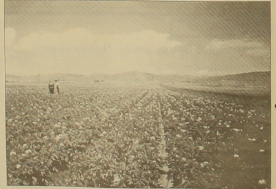
Նկատելի ունենալով, որ մարզի նախաձեռնային եւ լեռնային գոտիներում կարսոֆիլն առաջնություն է բարձր թեր, մի բարձր ազարակաճեթեր ընդգրկվել են կարսոֆիլի սերմարտադրության ծրագրում: Ի դեպ, մինչեւ վերջերս Սյունիում կարսոֆիլն արտադրում էր միայն ղարբերաբար մասնազգային Կարսոֆիլի մեակուրյաթը զբաղվող ազարակաճեթերի գերակառող մասը սնկում էր անհայտ

թյուն, չեն ավելացել համադասախան աշխատատեղեր, ինչը Հայաստանի ղեկավարության մեծ թերությունն է: Բարձրակարգ բանվորական ուժը ցրուցան է եղել, նվազել, եւ անխնա լուծարվել են եղած արտադրական միավորումները, ֆաբրիկաները, չլացել են արտադրության մասնագետները, եւ այսօր «ոչ մի ընտանի» չունի մասնական կերակրող: Ավանդների վերադարձի հետ կապելով նաեւ եկող սարվա նախագահական ընտրություններում իրենց հնարավոր դիրքորոշումը, նամակի հեղինակները նկատել են տալիս, թե «ժողովրդի լուսանումը վերադարձնելու խոստումը ազնիվ միտք է, որի կատարումը կհամարվի ազնվագույն եւ մեծահոգի արար»: Գ. Մ.