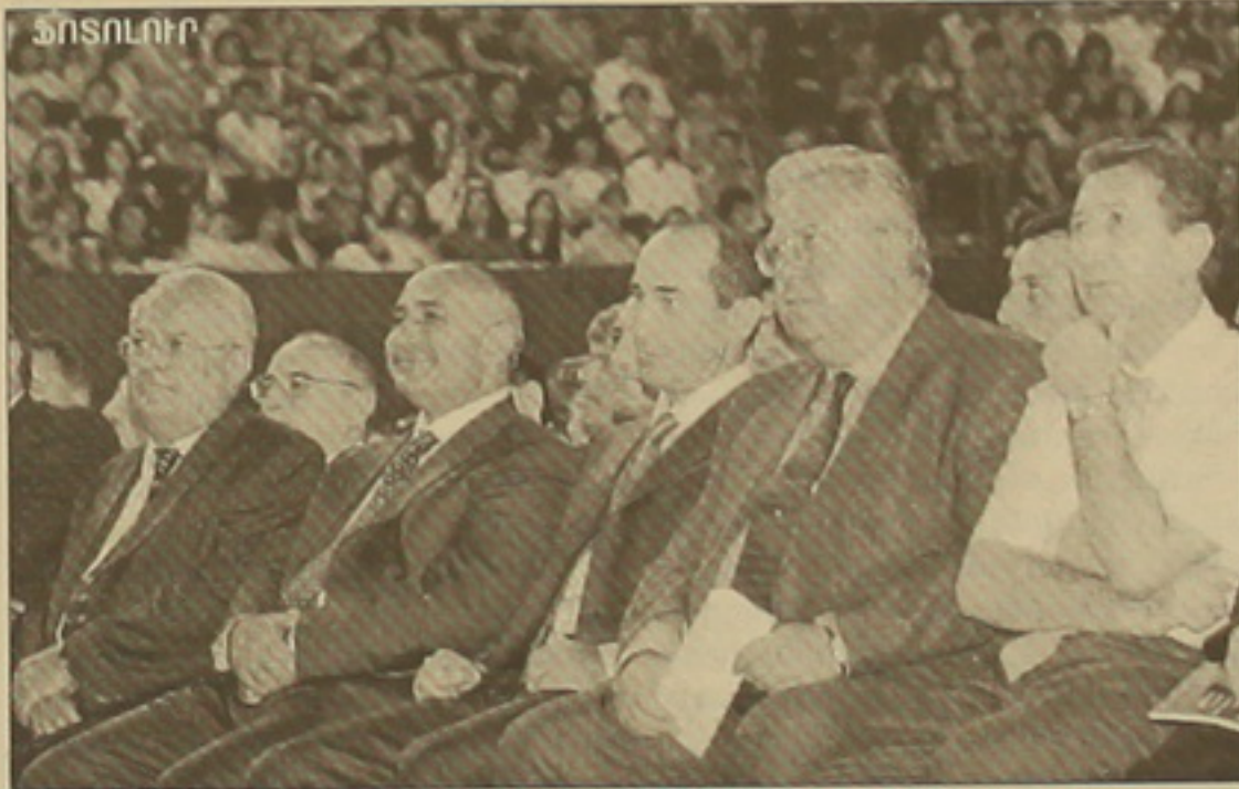
Տոնակարգում մասին» նոր օրերն, եւ հարկ է քննարկել թեթևություններն ու դրական կողմերը:

ԵՐԵՎԱՆ, 27 ՕԳՈՍՏՈՍ, ԱՐՄԵՆԻԱ: Հայասանի համայնքների միությունն այսօր հրավիրել էր երրորդ արտահերթ համագումարը: Համագումարին մասնակցում էին Երևանի 6390 ղարկիակները: Հայասանի բոլոր համայնքներից: Համագումարի հրավիրյալների թվում էին ՀՀ նախագահ Ռոբերտ Զոհրաբյանը, ԱԺ նախագահ Արմեն խաչատրյանը, ղարկազմավորներ, կառավարության անդամներ: