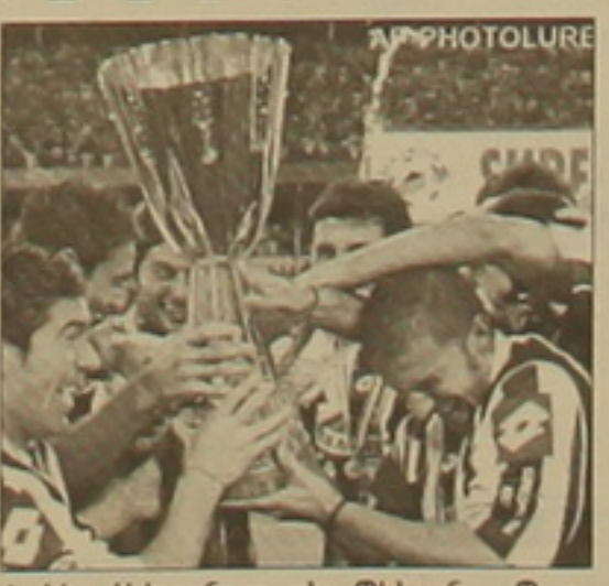
խփեց Ալեսանդրո դել Պիտոն: «Պարմայից» այն ընկալվեց Դի Կալոն: Այսուհետև, նոր մրցաշրջանում «Յուվենտուսը» իր առաջին շրջանին արժանացավ:

Թուրքի «Յուվենտուսը» դասարանական մեջ մտնող իսպիայի սուղեբերակաբար, որը դասարանական մրցանակը նվաճել է Աֆրիկայում: Սուղեբերակաբի խաղարկության դասարանական մեջ սա երկրորդ դեմքն է, որ հանդիպումն անցկացվում է Իսպիայից դուրս: 10 տարեկան իսպիայցիներին հյուրընկալել էր Վալենտինոսը, իսկ այս կիրակի խաղը անցկացվեց Տիբուրիում: Նախաձեռնողը Սուամար Կարաֆին էր, որին դասարանական «Յուվենտուսի» բաժնեմասնակցի 24 տղանը: «Յուվենտուսի» մրցակից «Պարման»-ն ընդունեց հրավերը: Հետաքրքրական մրցակիցում անցած հանդիպումը 2-1 հաճվով զանազան «Յուվենտուսը», որի կազմում 2 զույգեր է