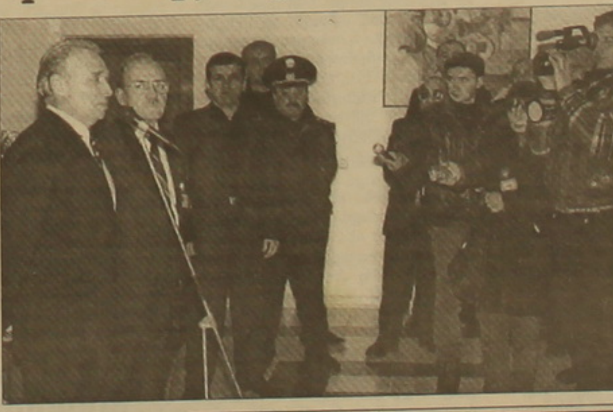
Բացման արարողությանը ներկա էին ՀՀ փոխարտգործնախարար Ռ. Շուկարյանը, ՀՀ արտգործնախարարության, հանրապետական զեւսեությունների ու կազմակերպությունների ղեկավար ներկայացուցիչներ, Գյումրու ֆաղափառ Վ. Դուկասյանը, ինչպես նաեւ տեղական մարզային ու ֆաղափային վարչակազմի, մշակութային ու հասարակական օրգանակների ներկայացուցիչներ, գործարարներ, ՌԳ զինված ուժերի 102-րդ ռազմակայանի եւ դաժանային սահմանադաժան օտարախոս Գյումրու սահմանադաժան ջոկատի հրամանատարներ:

Ինչպես տեղեկացնում է ՀՀ-ում ՌԳ դեսպանատան մամուլ խումբը, հունվարի 25-ին Գյումրիում տեղի ունեցավ Ռուսաստանի Դաժանության գլխավոր հյուպատոսության դաժանական բացումը: Բարձրացվեց Ռուսաստանի Դաժանության դրոշմը: Բացման արարողության ժամանակ ելույթ ունեցան Ռուսաստանի դեսպան Ա. Դյուկովը, ՀՀ դաժանության նախարար, ռուս-հայկական սենսեական համագործակցության միջկառավարական հանձնաժողովի համանախագահ Ս. Մարգարյանը, Շիրակի մարզպետ Ֆ. Փիրումյանը: Արարողությունը բացեց գլխավոր հյուպատոս Պ. Սուլիմկոն: