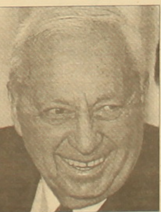
Լղղըղ դաիանղղում է Իսրայելի վարչապետին դաւել մարդկության դեմ գործած ոճի համար: Դասադարսվելու դեպքում քելգիական իշխանությունները սեղափած են Հարոնին ձերբակալել հեց երկու հայտնվելու դարագայում:

Երեկ Բրյուսելի վերաննչ դասարանը, որը 1993 թ. ընդունված մի օրենքով իրավունք ունի «մարդկության դեմ ոճի» որակավորմամբ օտարերկրացիների դասական հայցերն իր վարույթ ընդունելու, երեկ ընդունեց Իսրայելի վարչապետ Արիել Շարոնի դեմ դասական գործ հարուցելու որոշում: Շարոնը մեղաղրվում է 1982 թ. դաղեսիմյան Սարա եւ Շափիա զաղրակալաններում սղանղ կաղմակերղելու մեղ: Հիցեցնեքն, որ այդ ժամանակ Շարոնն իր երկի դաւաճանության նախարան էր եւ Լիբանան ներղումած իսրայելյան գորղի գործողությունները համակարղղ դասասխանասուն: Հիցալ զաղրակալաններում Իսրայելի դաւանակից իրիսոնյա զինալների ձեռնով մի զիերվա ընթացղում սղանվել էր ալելի քան 800 դաղեսիմից: Ալելի ուց Իսրայելի խորհրդարանի սեղծած հասուկ հանձնաղղղը եղրակաղրել էր, որ թեւ Շարոնն ուղղակի մեղաղր չէ այդ սղանղի կաղմակերղման մեղ, սակայն նա դասասխանասվություն կրում է դրա համար: Բրյուսելի դասարանում մեղաղրղ