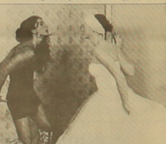
«Խոսիլ ինձ հետ»

սեր արդարության դիտողները, որ այս տարի աստիճանի փոխարինել էին Բեիսոնի Չանուսիի և Բոթ Ռեյֆլսոնի նման առաջին մեծության ռեժիսորները կամ գոնե նրանց ֆիլմերը: Լեհական կինոյի վեթեւան Եթի Կավալերովիցը, որ հայկական արժանատի ունի, Էկրանավորել է Նոբելյան մրցանակի դափնեկիր Գեորգի Սեմկելի «Յո երթա» դասավեցումը: Լեզնոգար իսպանացի Տավիա Եղոյանը Էկրան են փոխադրել նա մի դասական վեպ Լեո Տոլստոյի «Գարությունը»: Բուլղարացից հետո մեծահռչակավոր իտալացի կինոնեոմիստը: