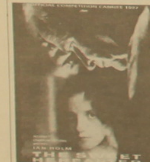
«Լուսեղեն գալի» ֆիլմի ազգազին

Կինոընկերությունը: ԿԱՐՏԱՆԵՐՈՒՄՆԵՐԸ. «Թայմ» հանդեսը հինգ տարի առաջ Եղոյանին ընդգրկել է «Երկայուն ստեղծագործող կարեւորագույն կինոարվեստագետների հարյուրյակում»: Դեյվիդ Քրոնենբերգի կողմից նա ներկայացնում է կանադական կինոյի դեմքը: