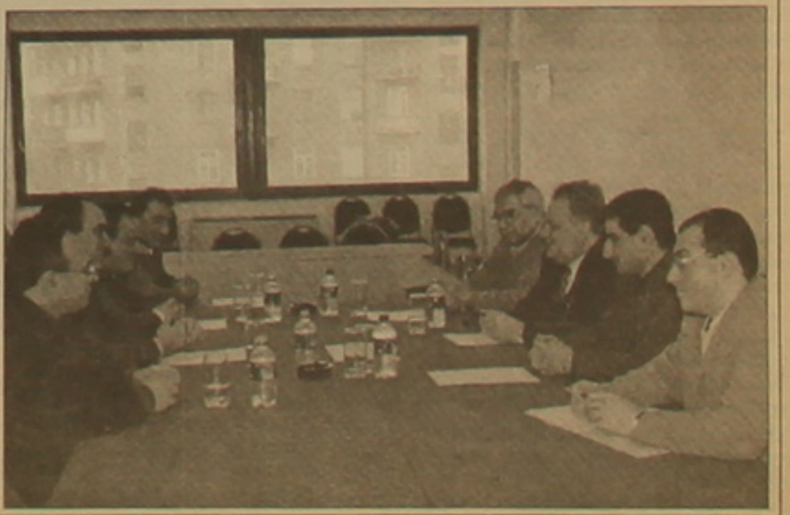
Գայրարանի Ռանեղյան Ազատական եւ «Օրինաց երկիր» կուսակցությունների ներկայացուղիներն ընղղ-

Թեղեղեղ հրատաղ նեղանկություն ունեղող քաղաղական եւ սղղղալ-սեղեղական հարցերի համաեղղ ունարկումների մասին: