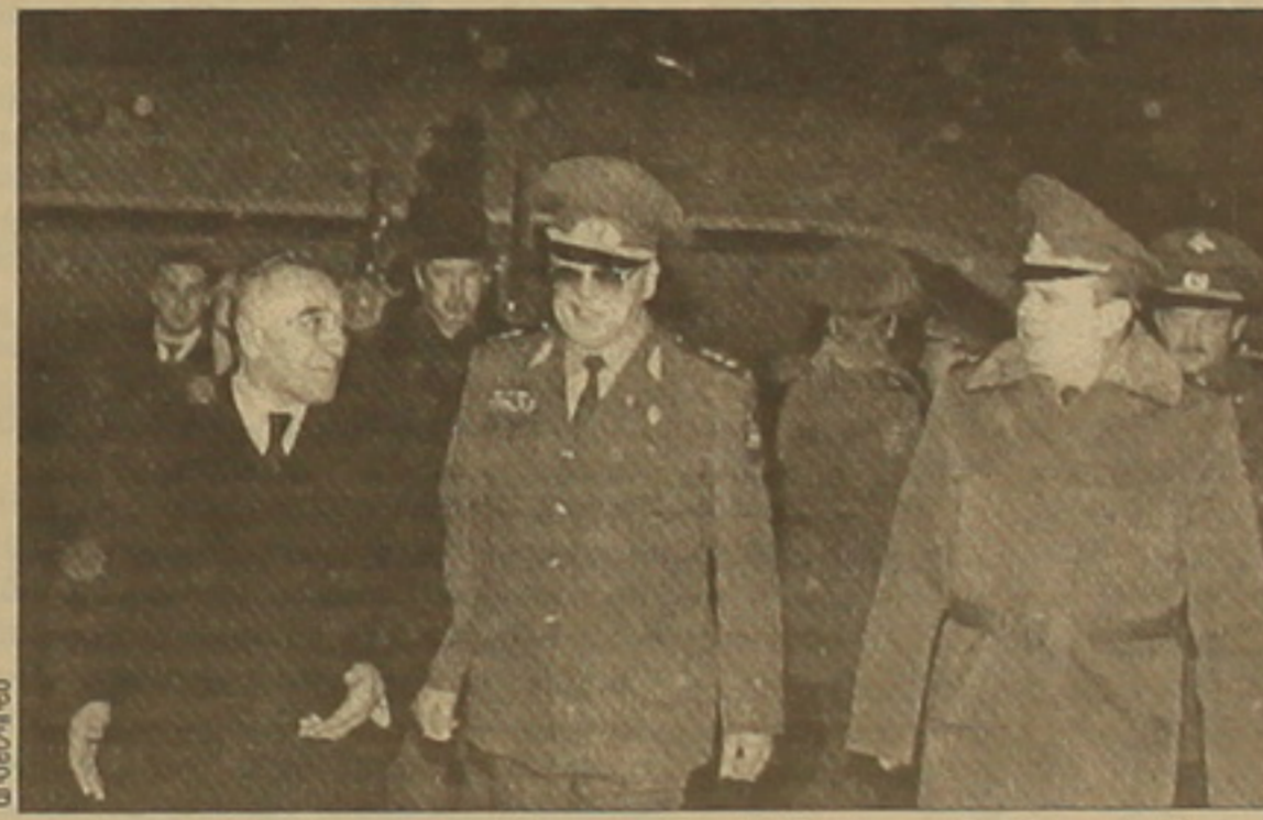
Տանգուրյան նախարար գեղերալ-լեղյեղանեղ Կարլոս Պեղրոյանը, նախարարության ղեղակար աշխատողներ, ինչղեղ նաեւ Գայրարանում ՌԴ դեսղայան Անասղի Դրկոլովն ու ՌԴ ՄԴԾ օղերաշիղ խնքի հրամանատարությունը:

ՏԵՂԱՐՈՒ ԼԵՂՆԵՂՈՒ ԻՏԱՌ-ՏԱՄՍ-ի թղրակիղ «Ազգի» համար Գայրարանը լիղկին կատարում ու գերակատարում է հանրադարձության սահմաններում սեղակայված ռուսաստանյան սահմանադրային զորքերի ֆինանսավորման գծով սանձնած լուրջանադային լուրջացումի լուրջացումները: Այդ մասին երեղ հայտարարեղ Ռուսաստանի Դաեղության սահմանադրային դաեղային ծաղալության (ՄԴԾ) սեղորեն գեղերալ-գեղադադեղ Կոնստանտին Տոգլիին: Նա երեւան ժամանեղ երեղոյան մեկոյա աշխատանքային այցով, որի լուրջացումի եւ Գայրարանում ՌԴ ՄԴԾ օղերաշիղ խնքի լուրջացումի մասին լուրջացումի նախահաեղի վերաբերյալ հուսադի ստորագրումը: Գայրարանյան կողմն սանձնել է օղերաշիղ խնքի ֆինանսավորման 57 տղոցը, հայտնեղ գեղերալը, որին դիմակորեցին ԳԳ ազգային անվ.