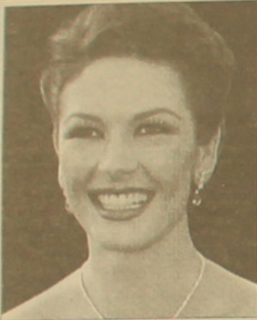
Բերին Գիսա Ջոնս

«Մուլիպան» ամերիկյան հանդեպը ավանդաբար հրատարակում է Հոլիվուդի 100 նշանավոր դերակրի ցանկը որտեղ մտնում դասակարգվում են «ամենա-ամենա» սկզբունքով ըստ իրենց ակադամ արժանիքի կամ քերական ճիշտ է ասել երբ ընտրված սիստեմներից շատերը հեղձակվում են երբեմն էլ խաթիչ բայց ամենուրեք հեռու չեն իրականությունից Ներկայացնում են 50 ամենաբնորոշ սիստեմներին հարկ եղած դեղին ամենաճշտ մեկնաբանություններով