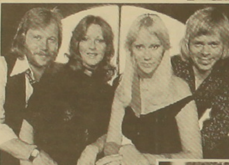
Քյան կողմից: Այս Էյսի 19-րդ աննամյա արարողությունը Տեղի ունեցավ մայիսի 20-ին Բեռլինի Ֆիլդոմ: Տարվա երգչուհի Նարեայից «Դեքսերիզ

Այս Էյսի արարողությունը Տեղի ունեցավ մայիսի 23-ին Լոնդոնում: Առավելագույն նվաճումը գրանցեց Քալի Մինոզը, որի Can I get you out of my head («Չեմ կարող եմ Էյս Էյսից հանել») երգն արժանացավ 3 մրցանա-