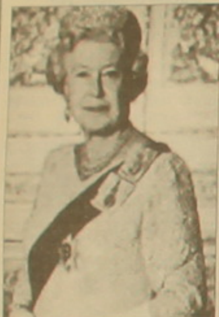
Հունիսի 3-ին Բեռլինում տոնակատարություն է կատարվում Էլիզաբեթ 2-րդի թագուհու 50-րդ տարեդարձի կապակցությամբ կայացված բա...

գոյա մեծ համերգ, որին մասնակցեցին շուրջ 100 հազար հասարակական կյանքի անհատներ: Փոլ Մակարտնին, անխոս, օրվա հերոսն էր: Երբ զվարճանքը բոլոր աստղերից բաղկացած երգչախումբը, որը կատարեց Hey Jude ել All you need is love երգերը: