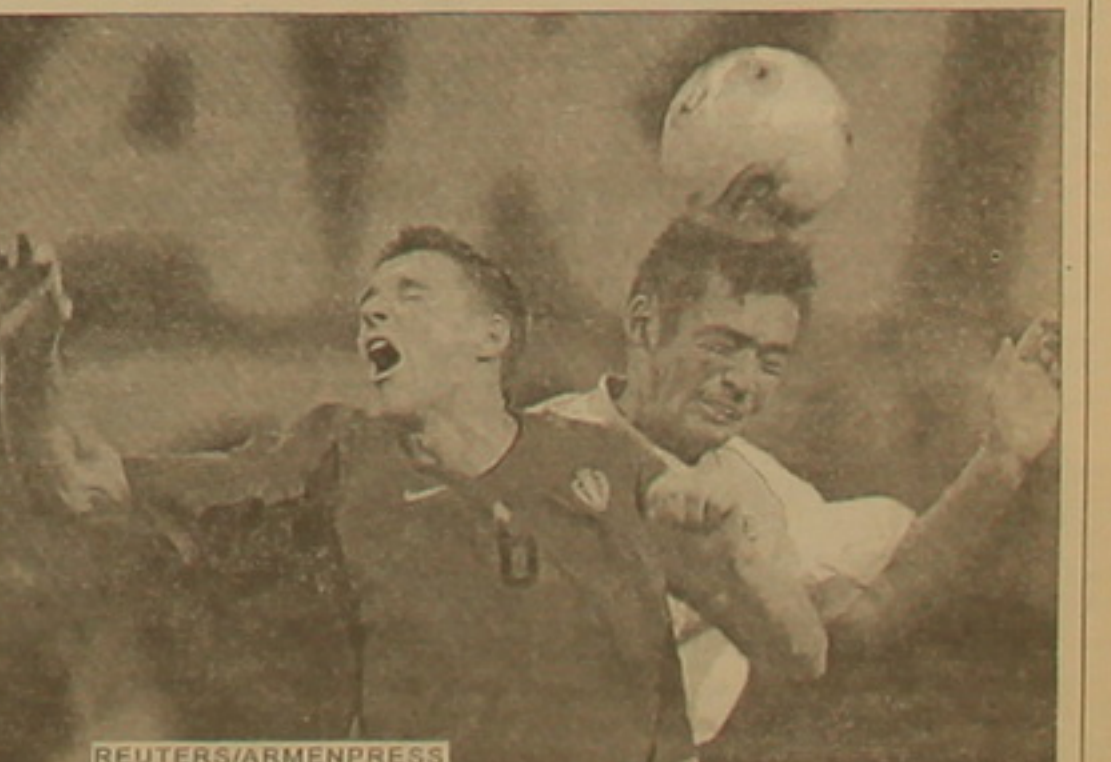
Էլ վկայում են, որ բարձր վարկանի ունեցող հավաքականները հաղթանակի հասնելու համար ստիպված են ներդնել իրենց ողջ կարողությունները, դրսևորել բարձր վարձեսություն:

Ֆուտբոլի աշխարհի 17-րդ առաջնությունը Երուսաղեմում է ֆուտբոլատներին անակնկալներ մատուցել՝ ստիպելով հիրավի համաժողովրդական խաղի սիրահարներին վերանայել այս կամ այն հավաքականի մասին ունեցած նախկին դատախազությունները: Անակնկալների թվով աշխարհի ընթացիկ առաջնությունը հավակնում է ձեկորդակրի դերին: Հերթական խոճո անակնկալը մատուցեց ԱՄՆ հավաքականը, որը տղավորիչ հաղթանակ տարավ եվրոպական ֆուտբոլի «հսկաներից» մեկի՝ Պորտուգալիայի ընտրանու նկատմամբ, որի կազմում հանդես են գալիս համաաշխարհային ֆուտբոլի մի շարք «աստղեր»՝ աշխարհի լավագույն ֆուտբոլիստ Լուիս Ֆիգուերայի գլխավորությամբ: Անկասկած, այդ հաղթությունն ամերիկյան ֆուտբոլի զգալի առաջընթացի արդյունք է: Սենեգալի, Հարավային Կորեայի, ճադոնիայի ֆուտբոլիստների հաջող ելույթներն