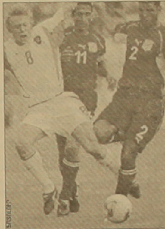
Ռարկեր սեփական դարձաբլ: Ընդմիջումից հետո խաղն ավելի դիսարժան էր: Նախ թունիս:

Թունիսի հավաքականի հետ խաղից առաջ Ռուսաստանի ընթացիկ ղեկավար մարզիչ Օլեգ Ռոմանցեւը խոսեցել էր հրաժարական չալ, եթե իր սաները չհաղթահարեն խմբային մրցաբարի արգելը: Թե ի՞նչ ճակատագիր է ստատու նրան եւ Ռուսաստանի հավաքականին, առայժմ դժվար է կանխագուսակել, սակայն ամեն դեպքում ռուսներին