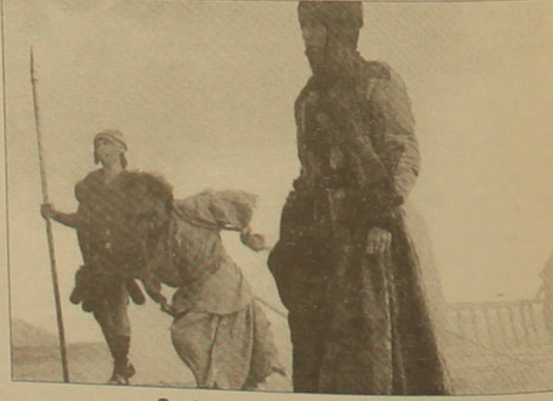
Պարսից սեղադրանի սառադանները:

Իսկ մինչ այդ սեղաներին մասնակցել էր ԱՄՆ-ի ազգային AFMA փառատին: Բրազիլայի կինոփառատից ընդամենը մեկ շաբաթ հեծո Մեքսիկայի Գվադալախարա փաղաում սեղի ունեղավ Կենտրոնական Ամերիկայի երկրների կինոփառատը, որտեղ «Տերնուսը» նվաճեց գլխավոր «Պրեզիդենտի մրցանակը»: Այս ամեն անուուս լուրջ հայտ են