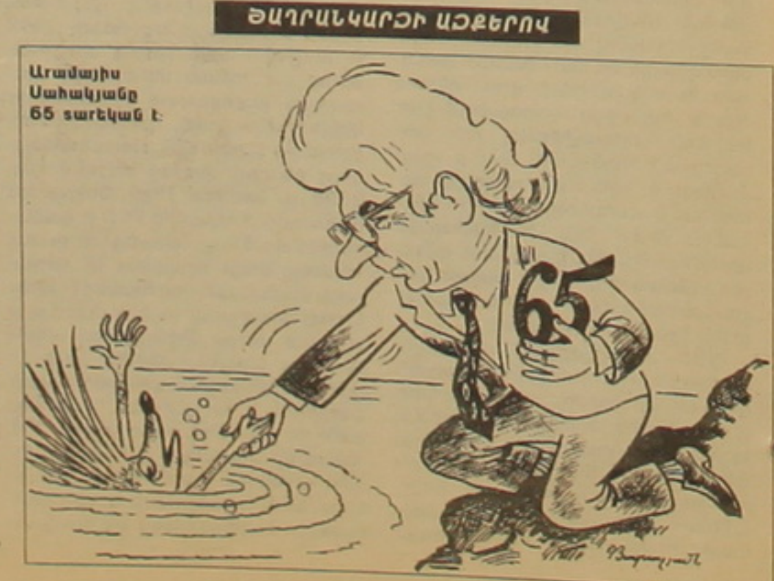
Արամայի Սահակյանը 65 տարեկան է:

ֆիլմերից, նկարահանվել է 2000 թ. ռեժիսոր Արեւա Իսեհիդոսի կողմից: Ցարը ներկայացվել է 5 միջազգային կինոփառատոնների, որոնց թվում նաեւ Ամստերդամից, որտեղ թվանդակության եւ կառուցվածի համար «հասուկ նաեւակության» է արժանացել: Բովանդակության հիմնում ընկած են վկայակցություններն ուր երիտասարդների, որոնք դեռ չին ծնվել 1974-ին եւ թուրական զավթման մասին իմացել են այն անեցից, ինչ իրենց դասուն է: