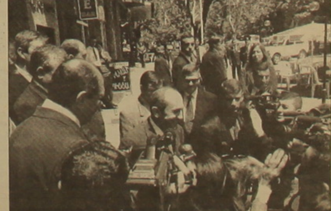
Շնորհանդեսի ավարտին Ռ. Քոչարյանը իր կարծիք է հայտնում լրագրողներին: