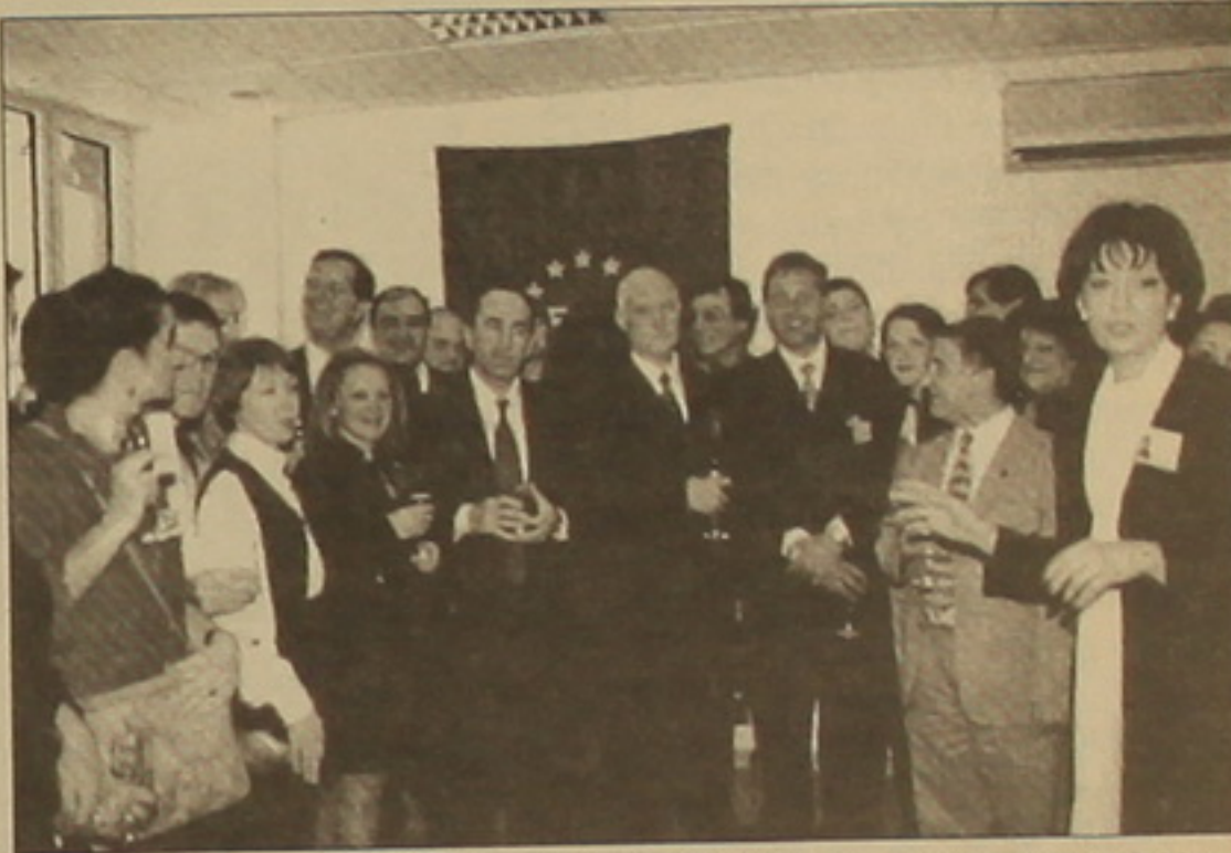
Ռ. Քոչարյանը բժշկական կենտրոնի աւխասողների հե:

Հիշեցնենք, որ «Եվրոպական բժշկական կենտրոնի» առավել սղավորիչ մասնաբաժինները աս- ամնարուժական եւ ընտանեկան բժշկության սեյնյակներ էին, որոնք օժտված էին գերադասական, հա- մակարգչային ու մոնիտորական գործիքներով, սարքերով: Ֆրանսիա- ցի փորձառու ասամնարուժ ղոկս. Բրեժոն իրականացնում է նաեւ կոսմետիկական ասամնարուժու- թյան, ասամի դաստիմայի եւ այլ բարդ գործողություններ օգտագոր- ծելով այնպիսի արհեստական աս- ամներ, որոնք ավելի դիմակայուն են, քան իսկականը: