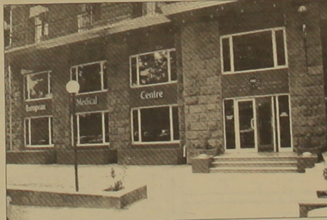
Երևանի Եվրոպական բժշկական կենտրոնը:

Ներդրում է ծառայի Հայաստանի ժողովրդի առողջադաստիարակ բարելավմանը: