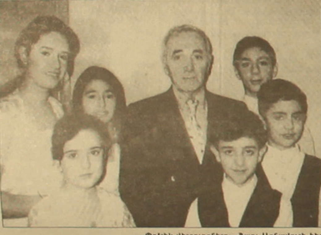
«Փոփիկ վիրտուոզներ» Շաղ Ազնավուրի հետ:

Անդրադասման առավել հիւարճաներին: 1999-ին Ֆրանսիայի «Հույս Հայաստանի համար» կազմակերպության հրավերով «Փոփիկ վիրտուոզները» համերգներով հանդես եկան Ֆրանսիայի եւ Անգլիայի 10 քաղաքներում՝ հնչեցնելով հայ եւ արեւմտեւրոպական կոմպոզիտորների ստեղծագործություններից իրենց կազմի համար (սեփսեթ) Մամվե Ավանեսյանի մշակմամբ եւ փոխադրությամբ: Ֆրանսիական մամուլը, ամփոփելով երաժշտական հասարակայնության կարծիքը, գրեց: «Մենք հիացած ենք «Փոփիկ վիրտուոզների» ելույթներով: Մեզ մոտ աս վիրտուոզներ են ելույթ ունեցել, բայց այստան փոքր տարիքի, այն էլ խմբով եւ Հայաստանից մեծ ուրախություն է բոլորիս համար (Evangelical Church of Armenia, 1999, N 1):