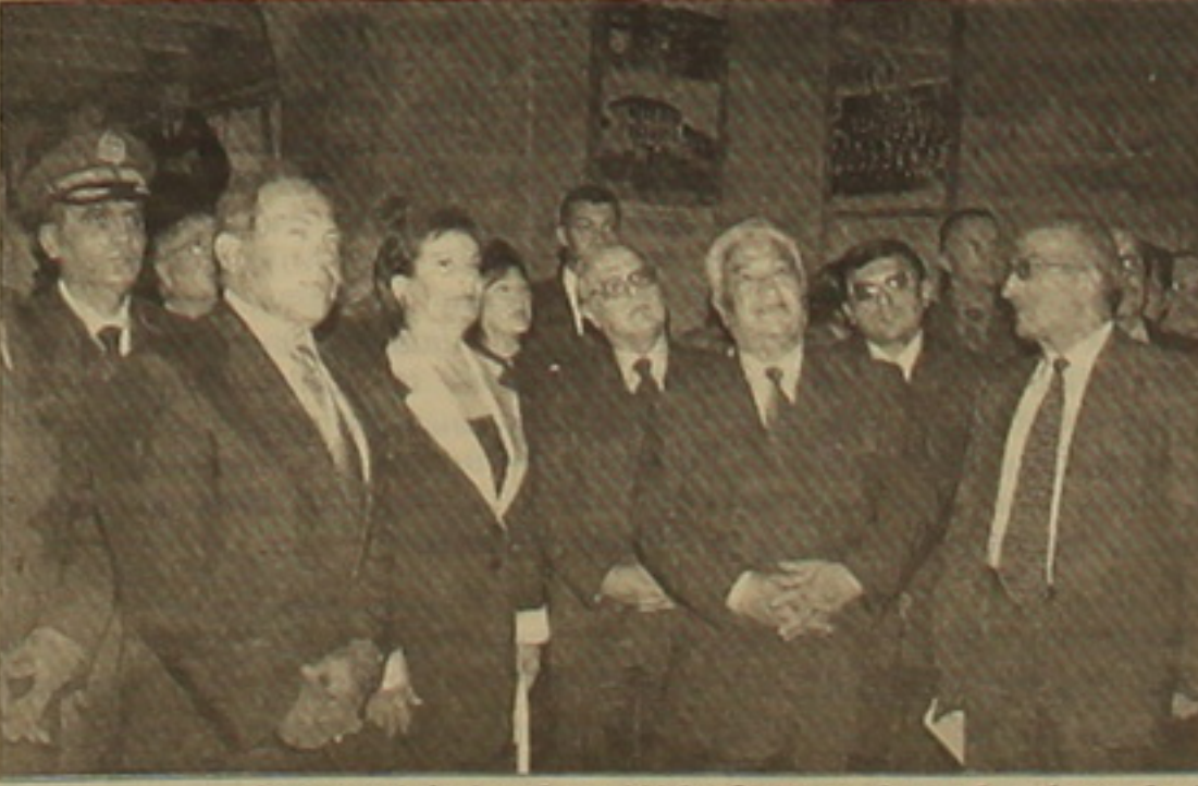
Նախագահ Լահիդը ու շիկից Գեղասպանության բանագրանում:

Սկզբը էջ 1 Լիբանանը միակ արաբական Պատգամավորն է, որի հետ Հայաստանը ստորագրել է «Բարեկամության ու համագործակցության» համաձայնագիր: Առհասարակ, հայկական ներկայության սեսակեցից Լիբանանն առանձնահատուկ երկիր է: Սահմանադրությամբ սեղի հայ համայնիկն հասկացված է մեկ կամ երկու սեղ գործադիր իշխանությունում (կախված կառավարության անդամների թվից) եւ հինգ մանդատ խորհրդարանում: Անցյալ տարի Լիբանանի խորհրդարանը երկրորդ առաջինից առավել ընդարձակ բանաձեւն ընդունեց Հայոց ցեղասպանության վերաբերյալ, որով «դատաարարում է հայ ժողովրդի դեմ գործարկված զանգվածային ցեղասպանությունը եւ արտահայտում է լիակատար աջակցություն իր հայ ֆառաֆայինների Պատգամին ու համարում, որ այս ցեղասպանության միջազգային ծանաչումն անհրաժեշտ է Պատգամային նման ոճրագործությունների չկրկնվելու համար»: Մի հասկանալի գիրքը նույնպես. «Իսլամական կրօնքերն»