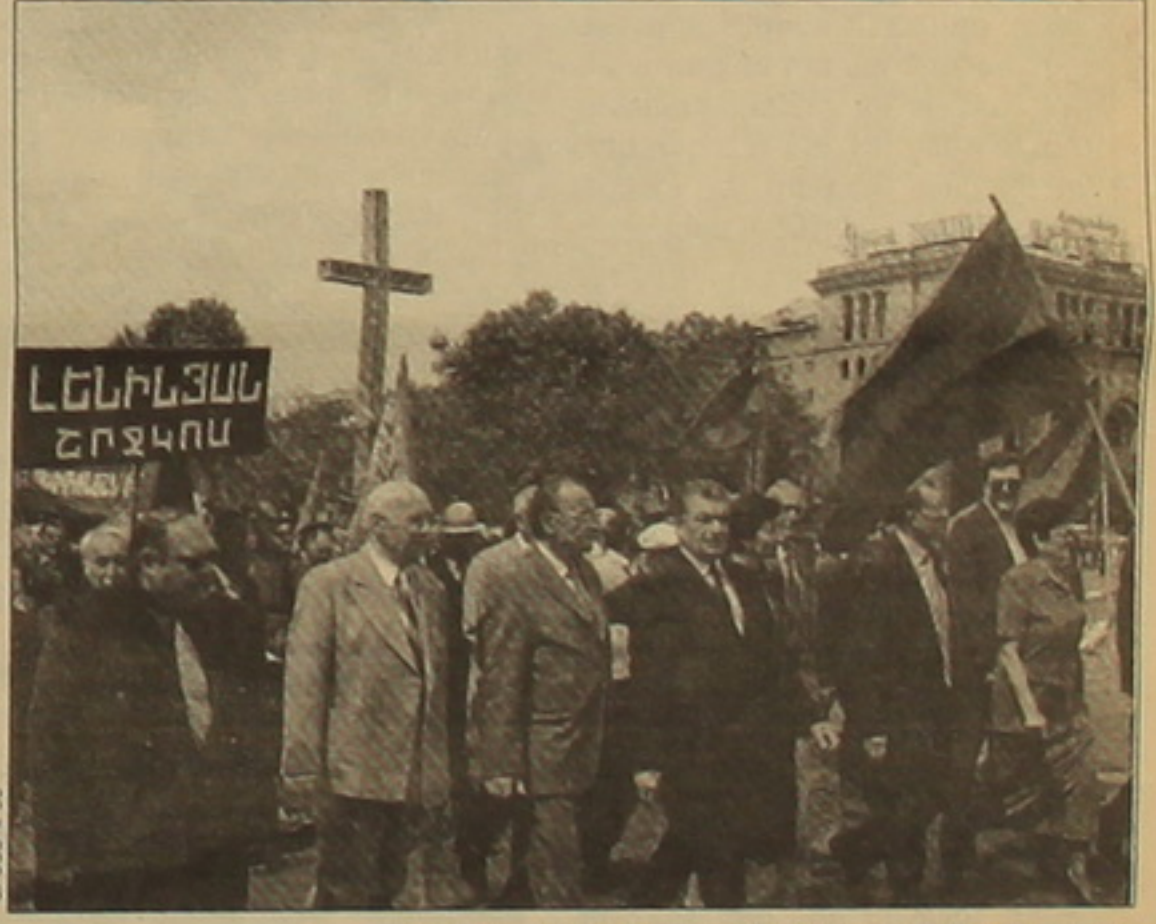
Մայիսի մեկի հանրահավաքի Երևանում խալի ներքին: