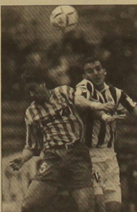
Ֆուտբոլի խաղարկության ժամանակ: Սակայն այն չկայացավ, քանի որ դաշտի տեղերը «Կիլիկիայի» ֆուտբոլիստները, հրաժարվեցին խաղալ:

«Շիրակ»-«Կիլիկիա» զույգի առաջին խաղում ոչ-ոքի (1-1) էր գրանցվել, եւ ամեն ինչ լուրջ է վճարվեց մրցաստիան հանդիպման ժամանակ: Սակայն այն չկայացավ, քանի որ դաշտի տեղերը «Կիլիկիայի» ֆուտբոլիստները, հրաժարվեցին խաղալ: