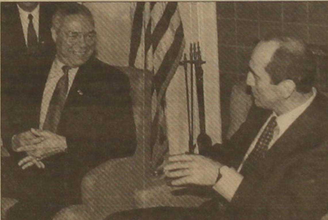
կան ուժերի իրականացում էթնիկ զտումների», Խոջալուի, ԵԱԳԿ գաղափարողների, «մեկ միլիոն փախսականների», «խան սոկոս սարածների զավթման» եւ ռուս ալյ բաների մասին, որոնք ուղղակի

ԹԱՍՏՈՒ ՏԱՎՈՐԵՍ, Արիլի 3-ին Ֆլորիդա նահանգի Քի Վեսթ ֆաղափ Գարրի Ս. Թուրմենի փոխնախագահը ԱՄՆ ղեկավարության Փառելի առանձին-առանձին, ԵԱԳԿ Միսսիսի խմբի համանախագահ երկրների ՈՂ-ի, ԱՄՆ-ի, Ֆրանսիայի ներկայացուցիչներ Ս. Գրիբկովի, Ք. Քավանոյի եւ Ժ. Ժ. Գայարդի մասնակցությամբ հանդիպումներ է ունեցել նախագահներ Ալիևի եւ Քոչարյանի հետ, որոնց ավարտին ԱՄՆ ղեկավարությանը, Ադրբեջանի եւ Հայաստանի առաջնորդները հանդես են եկել ՉԼՄ-ների համար հայտարարություններով: Եթե Փառելին ու Քոչարյանը խոսել են 1-2 րոպե, ապա Ալիևը՝ կես ժամից ավելի: Ադրբեջանի նախագահը ներկայանում էր «հայ-ադրբեջանական հակամարտության», «հայկա-