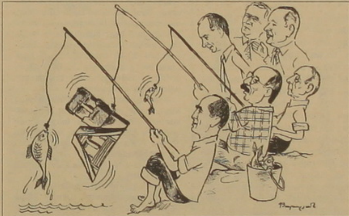
նում, Արբեջանում եւ ԼՂՀ-ում, «դիվանագիտական ձկնորսութեան» ի՞նչ ավար է ստացում Քոչարյանին ու Ալիեւին, վերջապէս ե-

ԹԱՅՈՒՆ ՏՎՈՒՅՆԱՆ «The Wall Street Journal» դարբերակաւ մարտի 23-ի համարում հրատարակել է «Հայաստանը եւ Արբեջանը կարող են խաղաղութիւն հաստատել» վերնագրով վերլուծականը, որտեղ, ճիշտ է, 13-ամյա «հայ-արբեջանական հակամարտութեան» մասին նոր բան չես գտնի, բայց ընթերցելը հաստատ վնասակար չէ, այլ թվում Հայաստանի նախագահ Քոչարյանի համար. «1997 թ. Հայաստանի նախկին նախագահ Լեւոն Տեր-Պետրոսյանը համաձայնեց կարգավորման «փուլ առ փուլ» սարքերակին եւ... գահագուրկ արվեց կոչ գծի հետեւորդների կողմից: Վերջիններս թվում էր ներկա նախագահ Ռոբերտ Քոչարյանը»: Այսուհանդերձ, ինչո՞ւ չէ՞նք է ներհաղափական վիճակը Հայաստանում, Արբեջանում եւ ԼՂՀ-ում, «դիվանագիտական ձկնորսութեան» ի՞նչ ավար է ստացում Քոչարյանին ու Ալիեւին, վերջապէս ե-