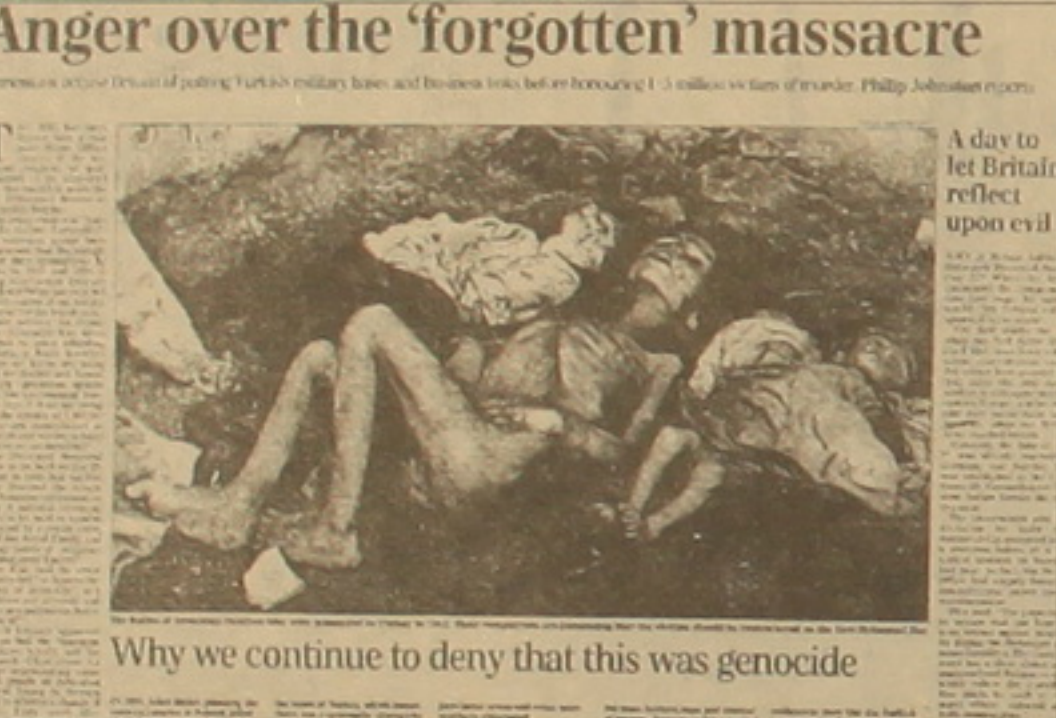
Anger over the 'forgotten' massacre A day to let Britain reflect upon evil Why we continue to deny that this was genocide

Լոնդոնում բոլոր դեսպանի բողոքներին սեղի սաղով աշխարհի անենամեն ղասկերարահներից մեկը «Հայրենի Գեթթի»-ն վեգներն իր ինստիտուտային ցանցից հանել է 1915 թ. հայկական ցեղասպանությանը վերաբերող երեք լուսանկար: Այս թեմային է անդադարձել հայսնի լրագրող Ռոբերտ Ֆիսին «Ինդիպենդենցի» թերթի մարտի 12-ի համարում վերոհիշյալ վերնագրի ներքո տղագրած իր հոդվածում, որը արգամարար ներկայացնում են ստորև: