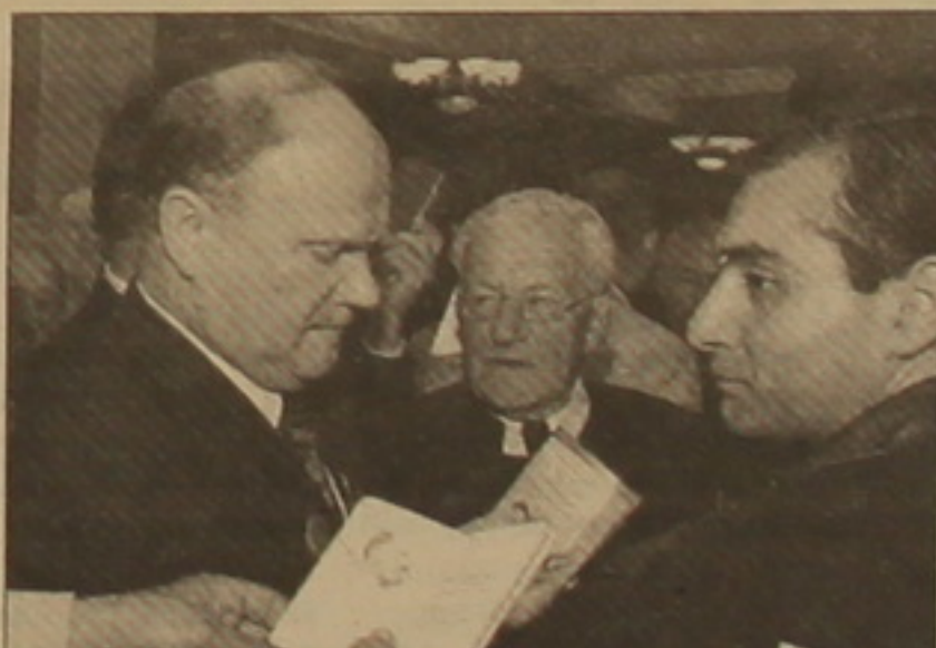
սում ղուսական ազդեցութեան ուժեղացմանը, ինչը ուղերձն է համարեց:

Երեկ մեկնարկեց Հայաստանի կոմունիստական կուսակցութեան 35-րդ համագումարը, որին իր ներկայութեամբ ղաւտվել էր ՌԴ Կոմկուսի առաջին արտարար Գեւորդի Զյուլաւնովը: Վերջինս իր ելույթի ընթացիւնում կարեւորեց Հայկունկուսի ղործունեութիւնը, իրաւ հայտնեց, որ համասեղ ուժերով կկարողանան վերականգնել «մարդկութեան ամենամեծ ու ամենախանցելի նվաճումը՝ Խորհրդային Միութիւնը»: ՌԴ առաջին կոմունիստ լրագրողների հետ ունեցած հարցազրույցում ցրցանցելով Հայաստանի Ռուսաստան-Բելառուս միութեանը միանալու ղաւտաւսաւարմարութեան մասին խոսելուց, այնուամենայնիւ վստահեցրեց, որ կովկասյան սարածաւրջանից Ռուսաստանի ղուրս ղալն եւկանորեն կվաւտարացնի սարածաւրջանի կայունութիւնը: Ըստ Զյուլաւնովի, ներկայումս ղաւտութեան ղիմված ուժերի համակարգում ընթացող կարգային փոփոխութիւններն ու բարեփոխութիւնները կնղաւտեն Անդրկովկասում ղուսական ազդեցութեանը, ինչը ուղերձն է համարեց: