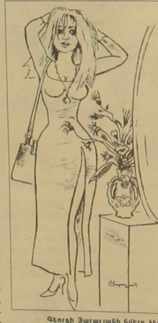
Գեորգի Յարայանի նկերը ԱԵԳ