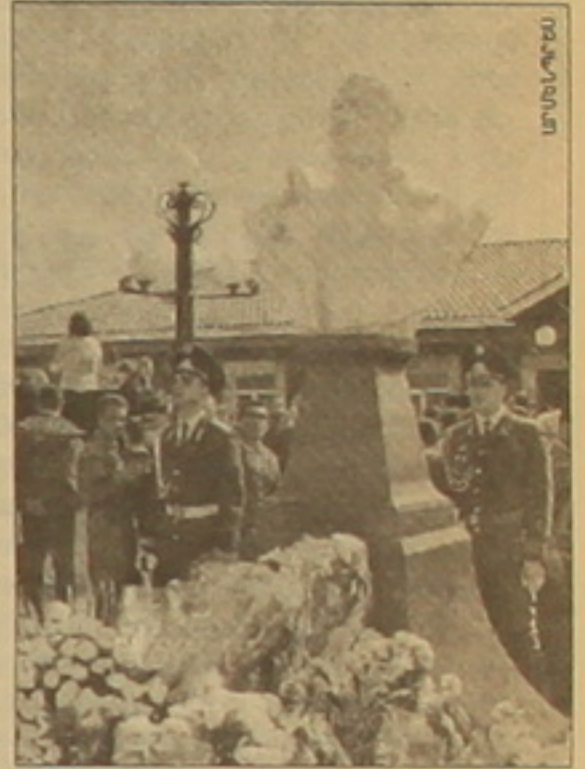
Վ. Սարգսյանը դարձավ մեծ գործարար, առաջ նվաճեց վարչապետ լինելու իրավունքը եւ դժբախտաբար հանցագործի գնդակը ընդհատեց նրա կյանքը:

Հանդիսությունը մասնակցող Որդաշահության նախկին նախարար Պավել Գրաչովը նշեց, որ Վ. Սարգսյանը ժամանակին եղել է իր ազակերը, եւ իրեն վիճակվել է Սարգսյանին սովորեցնել զինվորական գործը: Պ. Գրա-