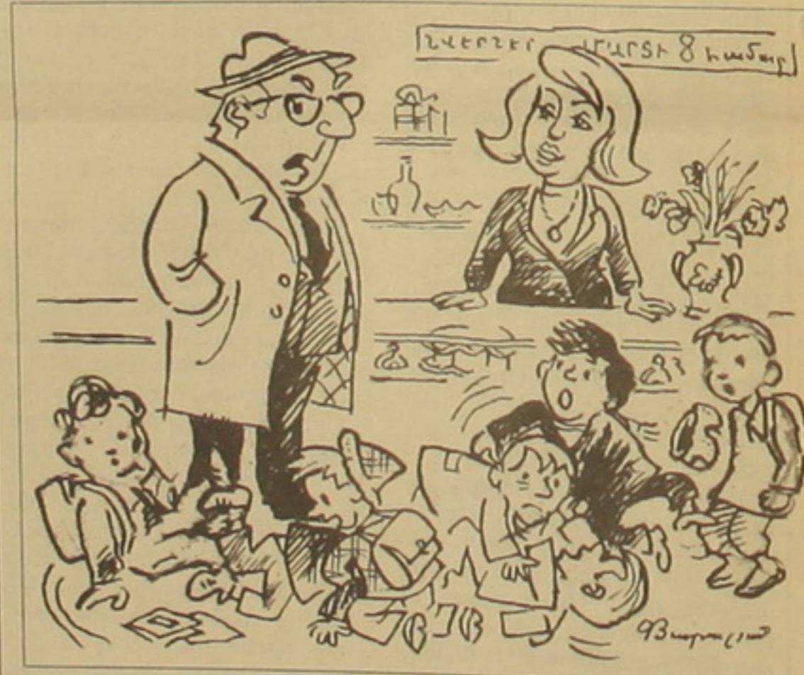
Սի վիճել. Բոլորն էլ կարող են նվերներ բերել