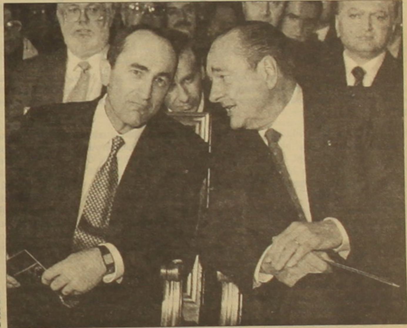
երգչախմբի ելույթը: Երգչախմբի ղեկավար, ԽՄԴՍ ու Հայաստանի ժողովրդական արտիստ, դեսական մրցանակների դափնեկիր Հովհաննես Զեփիջանին ատրհավորեցին համերգին ներկա նախագահներ Որքերս Բոչարյանն ու ժակ Երակը, Մրանց իկնայր Բելլա Բոչարյանն ու Բերնարդես Երակը, Փարիզի կարդինալ ժան-Լյուկ Լյուտիճեն: