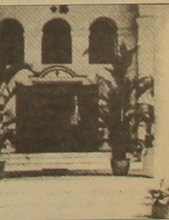
Մինգադուրի Ս. Գրիգոր Լուսավորչի էկեղեցու մուտք

Մինգադուր ֆաղաբ 1819 թ.-ին հիմնադրել է քրիստոնե Սրեմ-ֆլոր Ռեֆլորը: Մինգադուր նեանակում է առյուծի ֆաղաբ և սկզբնաղես մաս է կազմել Մալայզիային, հետագայում դարձել է քրիստոնեական գաղութ, աղա 2-րդ համաշխարհային լուսամասերի մի տարիներին գրավեց ճաղոնիայի կողմից և անկախացավ միայն 1965 թ.: Մինգադուրը այժմ կառավարվում է դեմոկրատական սկզբունքներով: 646 ֆառ. կմ