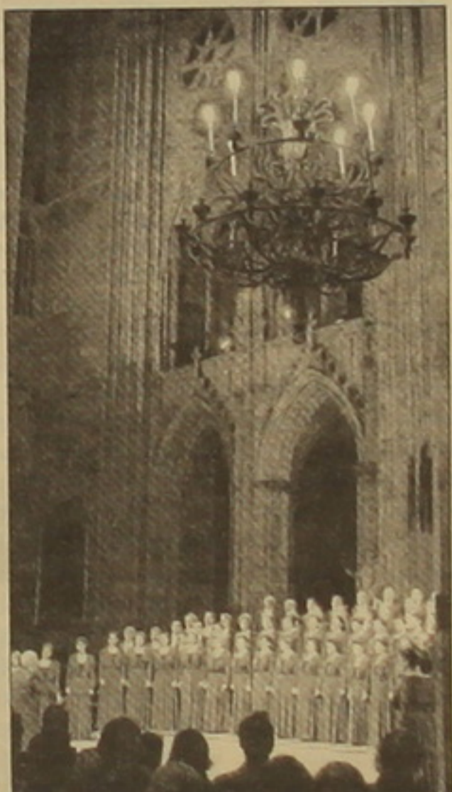
9 հազար փարիզեցիներ, որոնք երեւոթի երեկոյան հավաքվել էին Փարիզի Ասվածամոր տաճարում, տեսական ծափողջույններով, հոսնկայտ ողջունեցին Հայաստանի դեսական ակաղեմիական