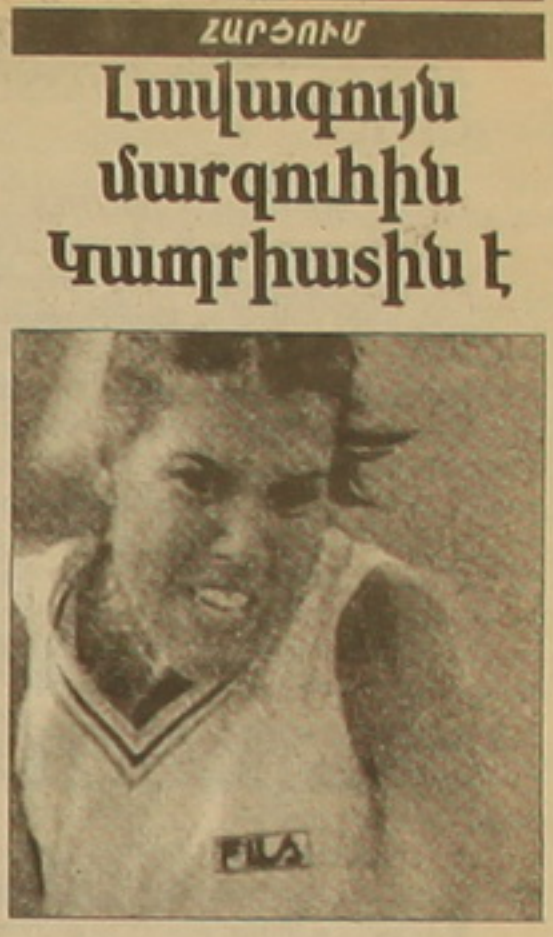
Տարեմուտին լրացված տարիներ գործակալություններ, քերթեր ու ամսագրեր զանազան հարցումներ են կատարում՝ որոշելու տարվա լավագույն մարզիկներին: Նման մի հարցում էլ անցկացրել է «Ռոյթեր» գործակալությունը, որի արդյունքում տարվա լավագույն մարզիկ է ճանաչվել ամերիկացի թենիսիստի Ջեյմս Կարթային: Հարցմանը մասնակցել են 31 երկրների քերթերի եւ ամսագրերի 40 խմբագիրներ: Կարթայինը վարձակալել է 61 միավոր եւ զգալիորեն առաջ անցել 2-3-րդ տեղերը 27 միավորով բաժանած թենիսիստի Կիմոս Ուիլյամսից եւ թեթևաչափ Մերինո Ջոնսոնից: Զորավոր հորիզոնականը զբաղեցրել է խորվաթ դահուկորդուհի Յանիցա Կուստիչը: Կարթայինը ընթացիկ մրցաբաժանում զբաղանց ելույթներ ունեցավ՝ դասնալով «Մեծ սարավաթի» ցարի 2 մրցաբաժանի հաղթող: Հիշեցնենք, որ Կարթայինը թենիսիստների ասոցիացիան Կարթայինին հռչակել էր այս տարվա աշխարհի չեմպիոնուհի:

Ծնորհավորելով Հայաստանի 10 լավագույն մարզիկներին, գալիքի մրցաբաժանում նրանց եւ մեր մյուս մարզածեւերի ներկայացուցիչներին մաղթեմք նորանոր, էլ ավելի ծանրակեղծ հաղթանակներ միջազգային մրցաստարներում: Նշենք, որ լրագրողներն ընդհանուր առմամբ հարցաթերթիկներում տեղ են միջազգային մրցաստարներում մեդալների արժանացած 20 մարզիկ-մարզիկների ազգանուններ: