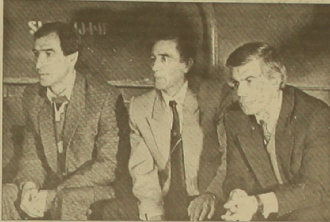
1992 թ. ազգային հավաքականի ԵՏԲԸ