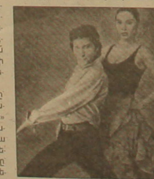
Սասուայի «Կարաներ» դեր 1909 թ., Ֆրանսիայում: Այդ ժա-մանակից ի վեր Մերիմեի հերոսուհին Եսուրանակ վերադարձել է էկրան նո-րանոր դեմերով, կինոօմեռայում ու

րիմեն, դոն Խոսեից բացի, իր հմայ-ների ծուղակն է գցել եւ կինեմատոգ-րաֆին: