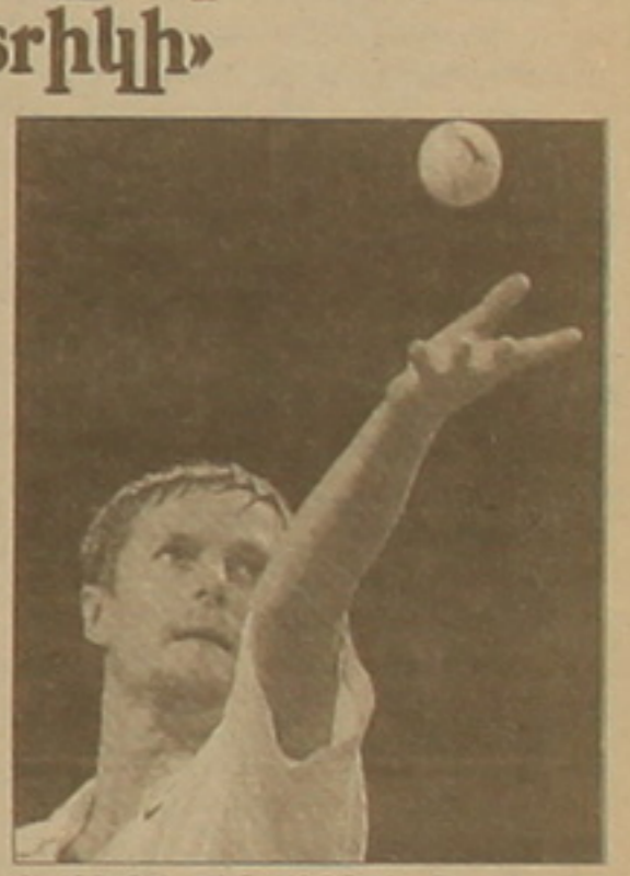
Կաֆելնիկովին: 1999 թ. նա այստեղ նվաճեց Ավստրալիայի բաց առաջնության չեմպիոնի կոչումը, իսկ 2000 թ. դարձավ օլիմպիական չեմպիոն: Այնուպես որ բացառված չէ, որ Կաֆելնիկովը Միդնեյում յուրօրինակ «հեք-սրիկի» հեղինակ դառնա:

Միդնեյում 8 ուժեղագույն բեմիսիսները Եարունակում են մայման աշխարհի չեմպիոնի կոչման համար: Արդեն հայտնի են կիսաեզրափակիչի մասնակցներից երեքը: Զեմպիոնի կոչման համար մայմանից դուրս մնաց Գուսակու Կուեստենը, որը երկուրդ դարձույթում կրեց այս անգամ զիջելով Ֆեռնանդին (6-7, 2-6): Իսկ ահա Կաֆելնիկովը հաղթեց իվանիեւիչին (6-3, 6-4), մնավ կիսաեզրափակիչ: Այս փուլում նա մրցակիցը կլինի ֆրանսիացի Սեբաստիան Գրոմանը, որը 6-3, 6-4 հաշվով առավելության հասավ Անդրեյ Արատու նկատմամբ: Վերջինս խաղից հեծ հայտարարել էր, որ ինչը ֆիզիկալաբան լավ մարզավիճակում չէ եւ հանդիման ժամանակ անընդհաճ մնաճում էր ընտանիքի մասին: Արատու եւս գրկվեց չեմպիոնի կոչման համար մայմանում հնարավորությունից: Իսկ ահա Գյուլիթը ոչ միայն Եարունակում է մայմանը, այլեւ հիմնալի հնարավորություն ունի բեմիսիսների դասակարգման ցուցակում քաղաքեղու Կուեստենին: Եթե, որ վերջին երկու տարիներին Միդնեյի կորտերը հաջողություն են բերել եվեբնի