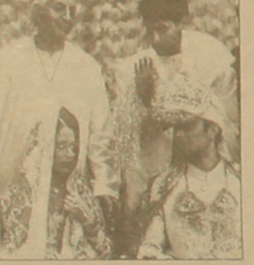
«Արեւելն Արեւել է»

ֆիլմն այնքան էլ ընդհանրություն ունի գրական սկզբնաղբյուրի անգլոսի Գեյնս Ֆիլիպիզի համարումն թեթևաբեղի հետ, որքան հոլիվուդյան նորարարի աստղ Ռենն Զելվեգերը խեղճ Բրիջիտ Զոնսի (իմիջիայլոց, վերոհիշյալ անհայտ «բանիմացի» ձեռնարկ Զելվեգերն էլ վերածվել էր Չելֆագերի):