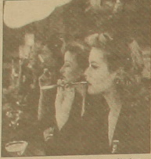
«Սիրո անդադրող ճիգերը»

միականի դու Ֆոլիվորդի ամենագուր արժեք է համարում: Նրա վերջին ֆիլմը՝ «Սիրո անդադրող ճիգերը» (1999), որով բացվեցին քրիստոնեական կինոյի օրերը Երևանում, կյանքի է կոչվել ամերիկյան դրամագիտով և հոլիվուդյան աստղերի մասնակցությամբ: Ավելին, իր հերթական շեփոխարան էր անցնում Բրանան ջանադարաբար ոճավորել է 30-ականների վերջի հոլիվուդյան մյուզիկլի մանրանկարները, այնպես որ կասկածաբար դեմոստրացիայի օրերը ծավալվում են «ջազի զվարթ դարաբացում» մայրամուտին և երկրորդ աշխարհամարտի նախօրեին: