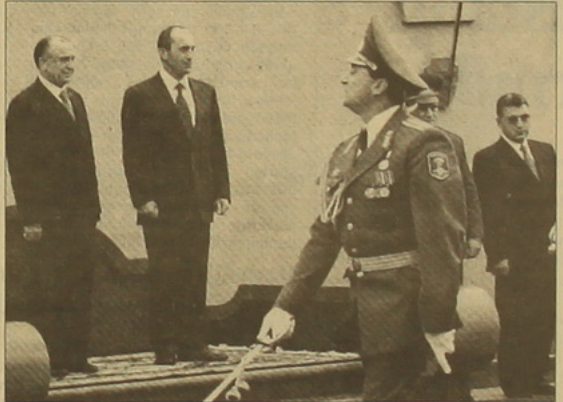
Sbu 1 էջ 2

ԼԵՆԻՆ ԳՐԻԳՈՐԵԱՆ, «Չափազանց ուրախ եմ, որ այցը Չայասան տեղի է ունենում քիսոփանությունը ձեր երկրում դեռևս կրոն հռչակելու 1700-ամյակի տարած: Մենք Բուխարեստում արդեն նշել ենք այդ տոնը», հավաստեց Ռուսիայի նախագահ Իոն Իլիեսկուն երեկ Երևանում իր դասընկերակց ալիսի Երզնանյանի հետ համատեղ մամուլի ասուլիսում: Մինչ մամուլի ասուլիսը, երկու նախագահների առանձնազրույցից եւ ընդհանրված կազմով երկկողմ հանդիպումներից հետո, ստորագրվեց երեք փաստաթուղթ, որոնցից «Համատեղ հայտարարությունը» ստորագրեցին Չայասանի եւ Ռուսիայի նախագահները: Մյուս երկուսը վերաբերում են մասնաինքնակազմակերպությանը եւ կազմակերպված հանցագործության դեմ լայնարձակ համագործակցությանը: