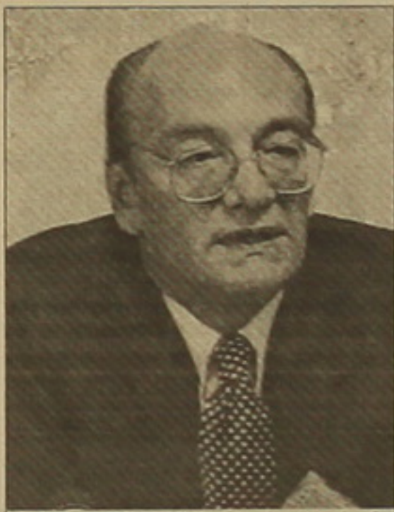
Ֆիլիպ ոը Սյունեյնի հետ կհանդի- պի Լիսաբոնում:

ԹԱԹՈՒՆ ՀԱՎՈՐՅԱՆ ԵԱՅԿ ՍԻՄՍԿԻ ամերիկյան նորանա- նակ համանախագահ Ռուդոլֆ Պերինան, որն այս դաշտամուրթյան փո- խարինել է Քերի Քավանոյին եւ իր դաշտակալություններին կանցնի Նոյեմբերի 1-ին, երկ մեկօրյա ճա- նաչողական այցով ժամանել է Ե- րեւան: «Ես նոր առաջարկներ չեմ բերել, չեմ բերել նոր գաղափարներ եւ ոչ էլ եկել եմ բանակցելու ԼՂ հարցի շուրջ: Ես եկել եմ ծանոթա- նալու իրավիճակին, ինֆորմացիա ծեմ բերելու, կողմնորոշվելու: Ա- վելի աստ լսելու եմ եկել», լրագ- րողների հետ հանդիպմանը նեց որն Պերինան: