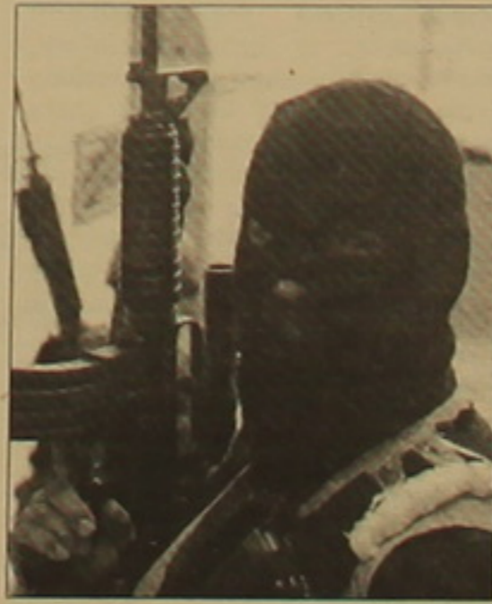
Տինյան հաղորդագրության, երեկ «Ձիհաղի» ակփիսներից մեկին Յուսուֆ Մալամեհ Քաթալիին մի Բանի դիմակավորներ առեւանգել են սնից:

Երեկ Պաղեստինի ղեկավարությունը մեղադրել է Իսրայելին, որի անվսանգության ձառայությունը սղանել է «Համասի» կարեւորագույն ղեկավարներից մեկին Իյման Խալավային: Նա մի Բանի ակփիսների հեճ մահացել է մեճեճայի մեջ տեղի ունեցած դայթյունից: Իսրայելն առայձմ հանդես չի եկել դաժանական հաղորդագրությամբ, սակայն անվսանգության մարմինները վկայել են, որ կասարվածը մահափորձ է: «Համասի» ղեկավարը եղել է դայթյունիկ սարերի ինձեներ եւ կազմակերպել է ահաթեկչություններ Երուսաղեճում, Թեւ Ավիվում, Նաթանիայում եւ այլ Բաղափներում: