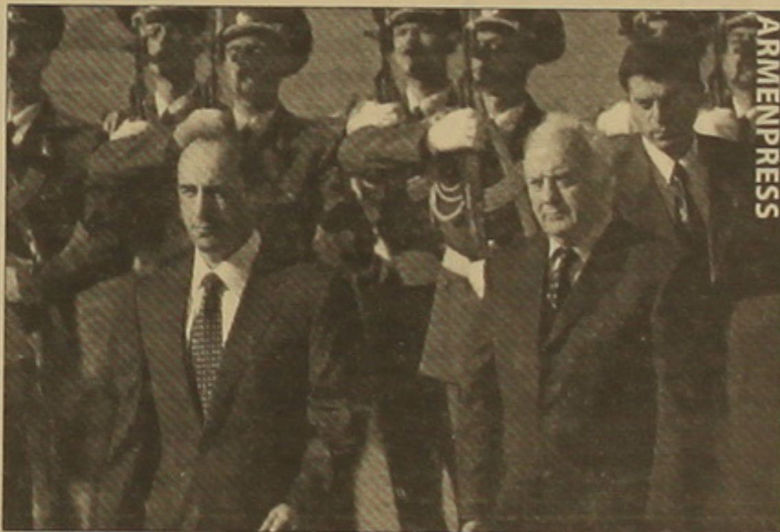
արարողություն: Բանակցություններին հեճո երկու նախագահներն էլ լարված եւ մտաուոգ տեղ ունեին: Հեճաբրական է, որ է. Շեարձիսա-

«Շնորհակալ եմ եղուրդ Շեարձի: Նաձեի՞ն Լճնարկունների անկեղծության համար եւ վստահ եմ, որ երկու նախագահներ ի զորու են Լճնարկել հարցերի լայն Երջանակ, այդ թվում միջոցական, միջոդողովրդական հարաբերություններին վերաբերող անճանուրթ թեմաներ եւ զսնել հավասարակուզված որոշումներ այնդես, որդեսգի երկկողմ հարաբերություններում եղած ավանդույթները զարգանան», Եեեց երեկ ՀՀ նախագահ Ռոբերտ Քոչարյանը Վրաստանի նախագահի Հայաստան դաժանական այցի Երջանակներում համասեղ մամլո աուուլիսին: Մինչ աուուլիսը նախագահների առանճնագրույցից եւ ընդլայնված կազմով միսից հեճո տեղի ունեցավ դայամանագրերի սսոուարման