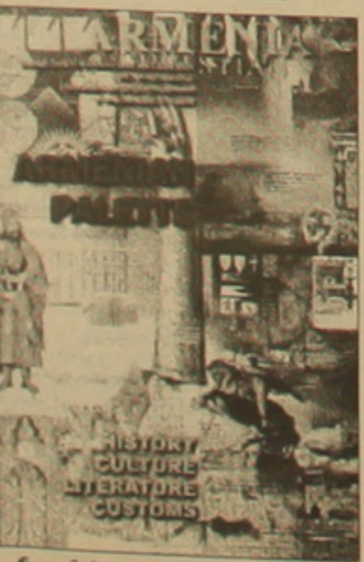
«Ճառագիտ», Հովհաննես Այվազյանի ու Մինաս Ավետիսյանի, Տորգ Բայրոն ու Կոմիտաս, Վիլյամ Մարտյան ու

Հայաստանն աշխարհին ներկայացնելու հազար ու մի ձև կա: Այս հազար ու մի ձևերից մեկն էլ օտար լեզվով, հասկալի անգլերենով հանդես եկող, ժուռնալներ, սեղեկատուներ հրատարակելն է, դարբերաբար հրատարակելը: Այս իմաստով ինչ բան է արվել, Ես ինչ բան: