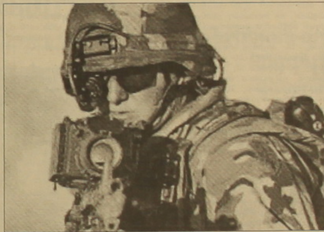
Shu • էջ 3

թյուններ, որ ամերիկյան հասուկ նշանակության ուժերն արդեն իսկ գործողություններ են ձեռնարկել Կանդահարում: Ամերիկյան օդուժի հարվածներից երեկ գերծ չմնաց Բաբուլի մոտ գտնվող ՄԱԿ-ի կենտրոնակայանը, որտեղ սղանվեց աֆղան մի աշխատակից եւ այրվեց ցորենի դահեստը: Մինչ Պենտագոնը հայտարարում էր, որ մնություն է ձեռնարկելու դարազան սուուզելու նպատակով, Բաբարի «Ալ Ջազիրա» հեռուստակայանը ցույց էր տալիս կենտրոնակայանը կրակների մեջ: Ավելի ուշ Խլամաբաղից ՄԱԿ-ի դատախազները հայտնեցին, որ կենտրոնակայանի սանիթին դաջված էր Կարմիր խաչի նշանը: